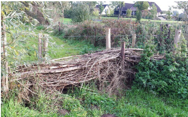
Takkenbos voor de egel

Rustplek met dichte bosschage, niet toegankelijk. Takkenbos plaatsen op egelkast. De takkenbos is minimaal 2 m3 groot.