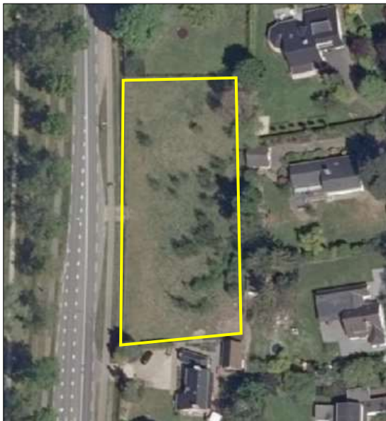
Begrenzing van het plangebied wordt met de gele lijn aangeduid (bron luchtfoto: ruimtelijkeplannen.nl).

Het plangebied bestaat volledig uit grasland. Dit grasland bestaat uit een soortenarme vegetatie en wordt intensief beheerd (bemesten, maaien en afvoeren maaisel). Het plangebied grenst volledig aan hekwerk van harmonicagaas. Op onderstaande afbeelding wordt de begrenzing van het plangebied weergegeven. Voor een verbeelding van de huidige situatie wordt verwezen naar de fotobijlage.