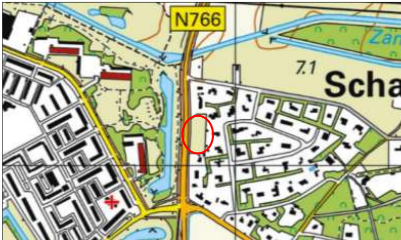
Globale ligging van het plangebied. De ligging van het plangebied wordt met de rode cirkel aangeduid.

Het plangebied is gesitueerd aan de Raalterweg ongenummerd (tussen nummer 4 en 6) te Schalkhaar, gemeente Deventer. Het ligt in het westelijke deel van de woonkern Schalkhaar en wordt omgeven door stedelijk gebied. Op onderstaande afbeelding wordt de globale ligging van het plangebied weergegeven op een topografische kaart.