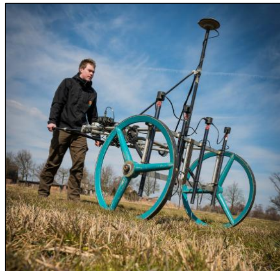
Afbeelding 2 – Multi-sonde systeem.

Doormiddel van het detectieselectie formulier is de meest effectieve wijze van detectie bepaald. Het opsporingsgebied van is zoveel mogelijk vlak dekkend gedetecteerd met een DGPS- non-realtime detectiesysteem, het Multi-sonde systeem (zie afbeelding).