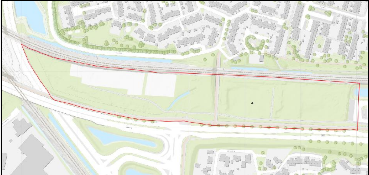
Afbeelding 1 – rood omkaderd projectgebied holterweg te Deventer

Het terrein gelegen aan de Holterweg tussen de N348 en ijshal de Scheg te Deventer wordt compleet heringericht. Momenteel bevindt zich op dit terrein een moestuin en ligt het overige deel braak. Het onderzoeksgebied is verdacht op de aanwezigheid van conventionele explosieven (CE).