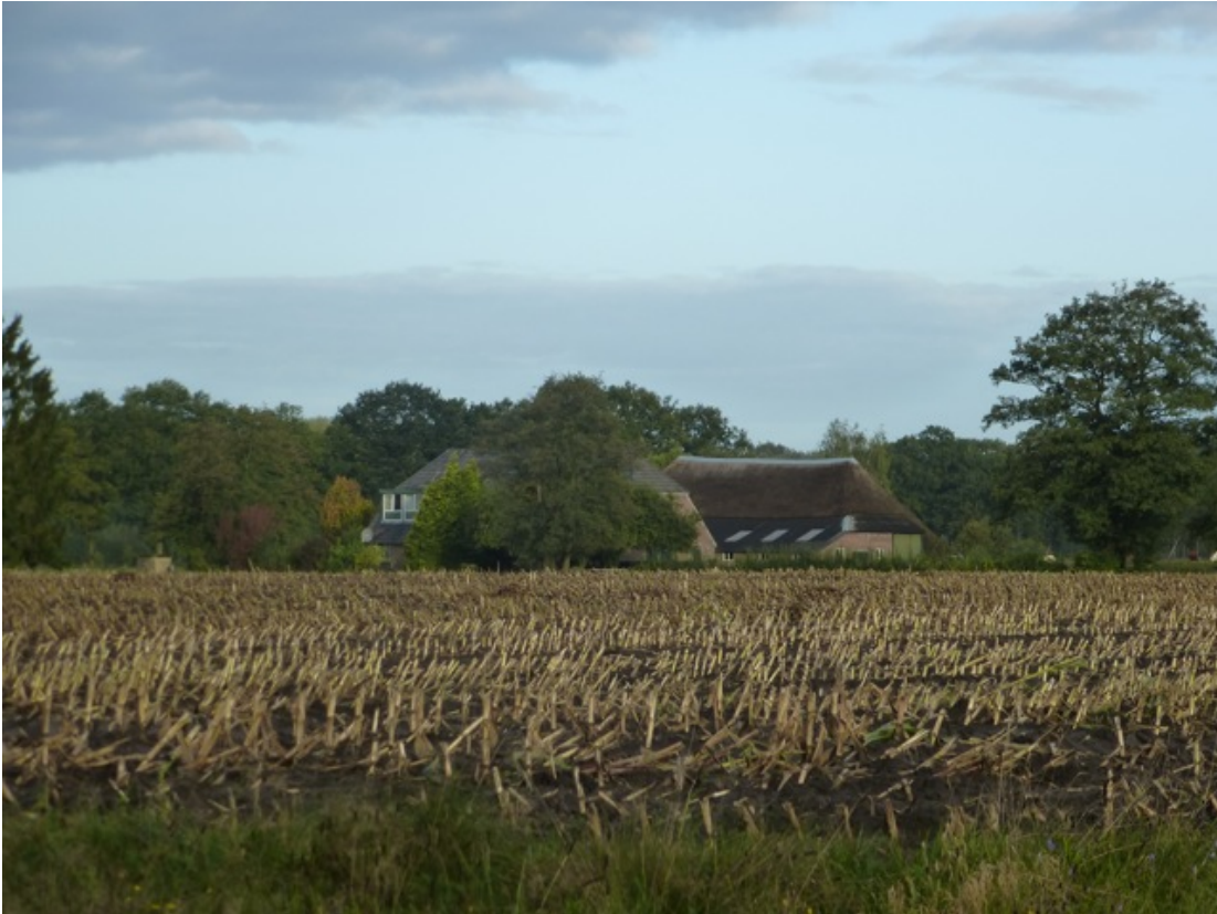
Vanaf de Holterweg, ingezoomd op de achterzijde van de boerderijen. (05)