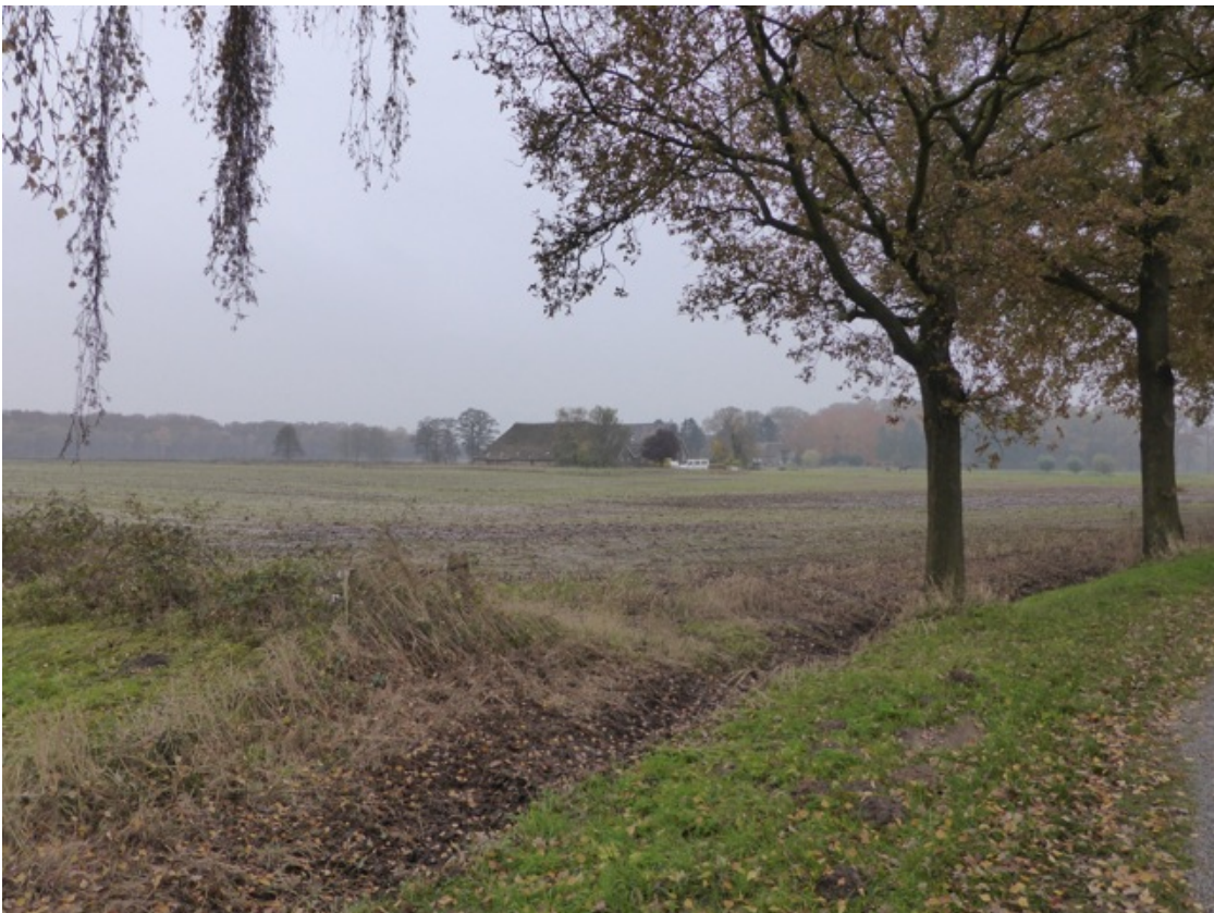
Vanaf de Aarninksweg, kijkend naar het zuiden(06)