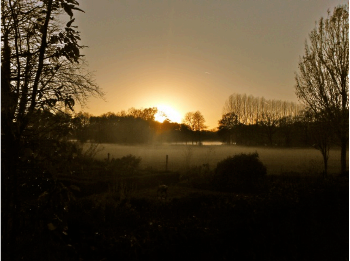
Gooiermars, vanaf de boerderij. (11)