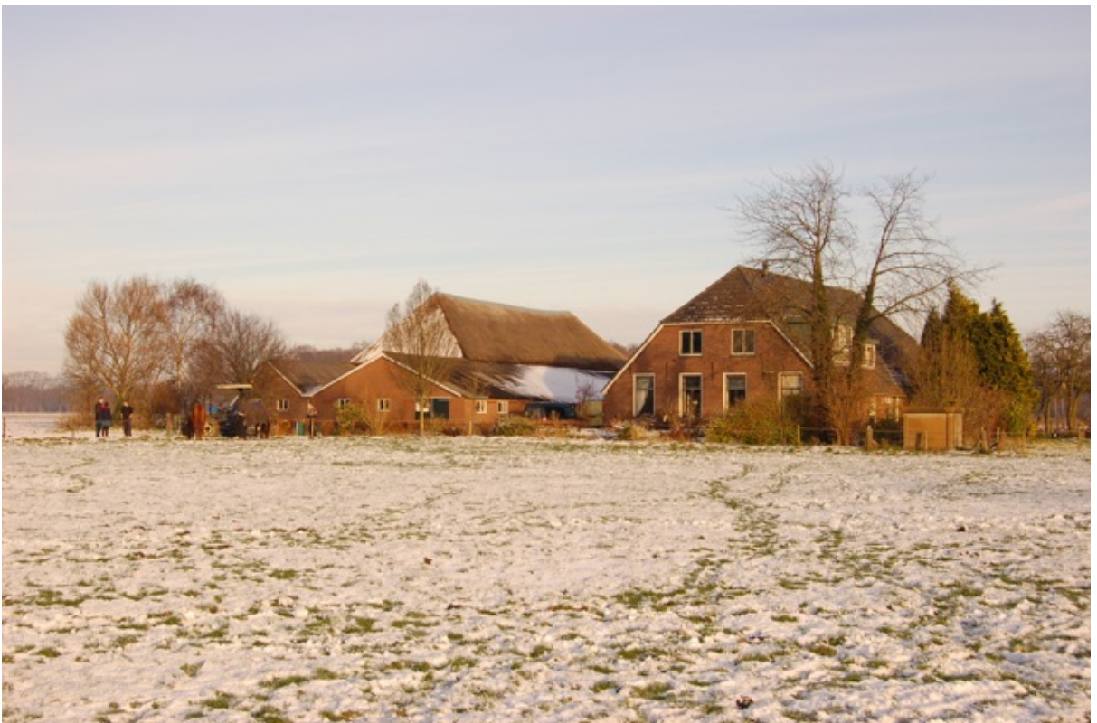
Modernisering in de jaren '80 heeft veel van de oorspronkelijke charme teniet gedaan. (02)