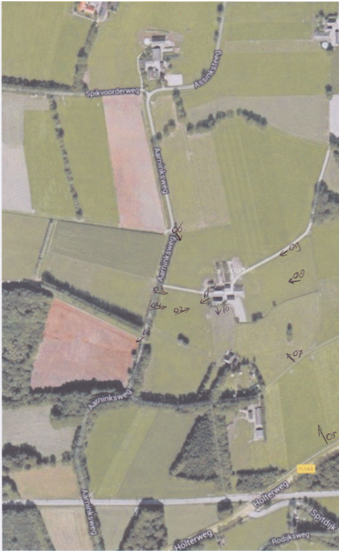
De cijfers corresponderen met het (getal) bij de foto's.