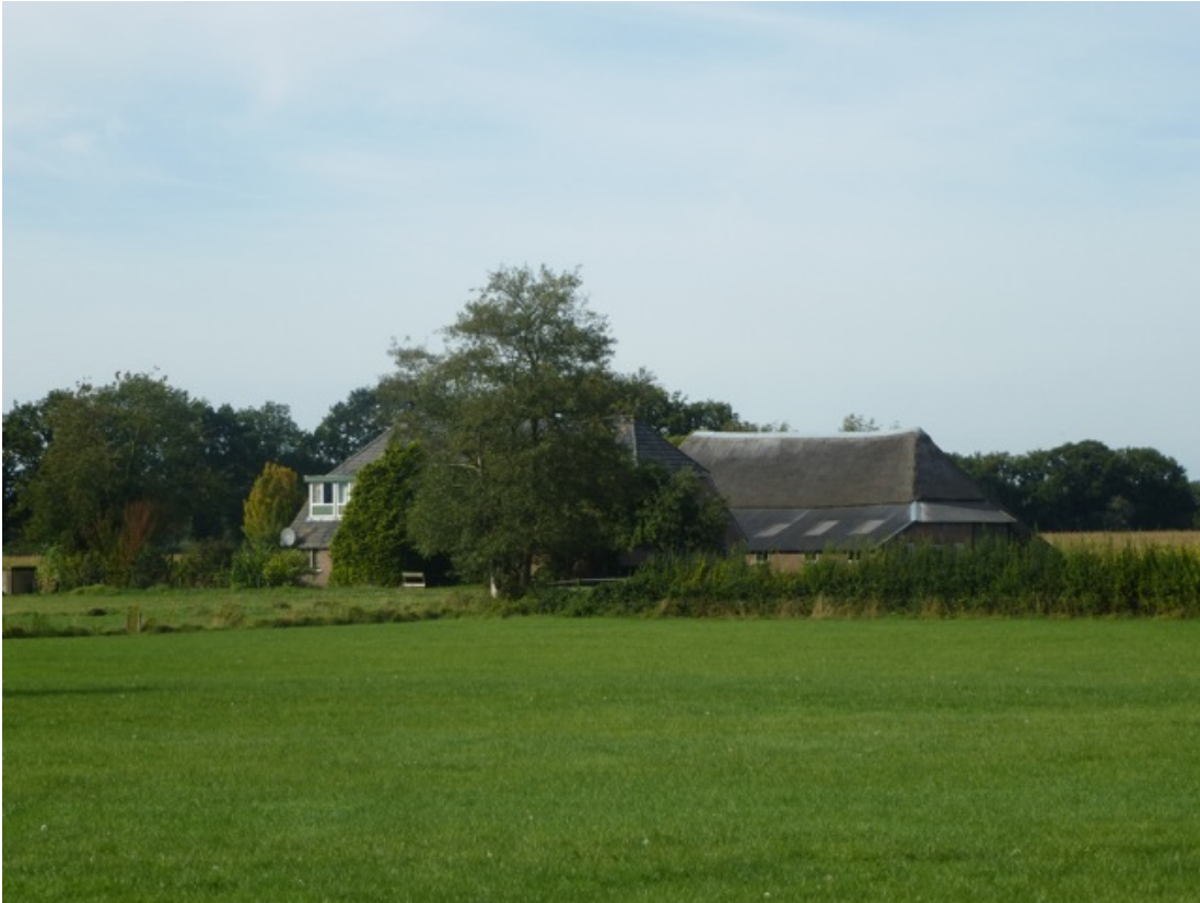
Vanaf het zuid-oosten, ingezoomd. (07)