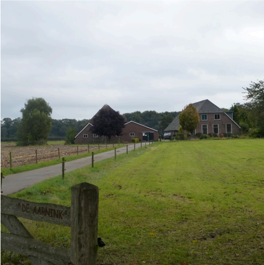
De rooilijn van de gebouwen is niet parallel aan de weg en ook de toegangsweg loopt scheef. (03)