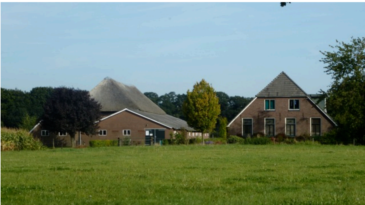
Hoewel de basisvorm door de eeuwen heen gelijk is gebleven is het verschil in leeftijd duidelijk te zien. (04)