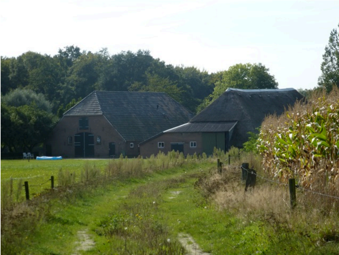
Achterzijde, ingezoomd. (09)