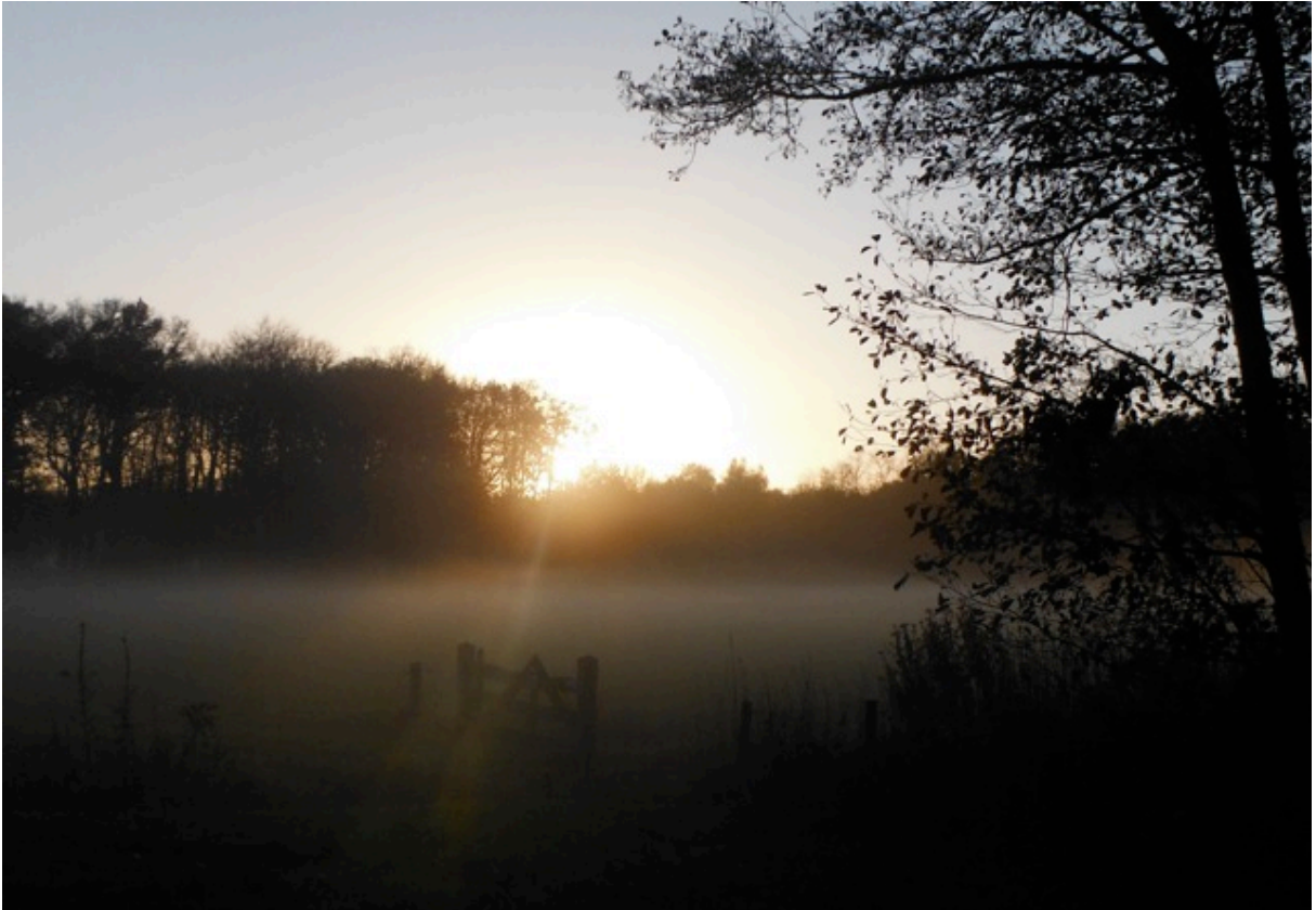
Gooiermars, vanaf de Aarninksweg. (12)