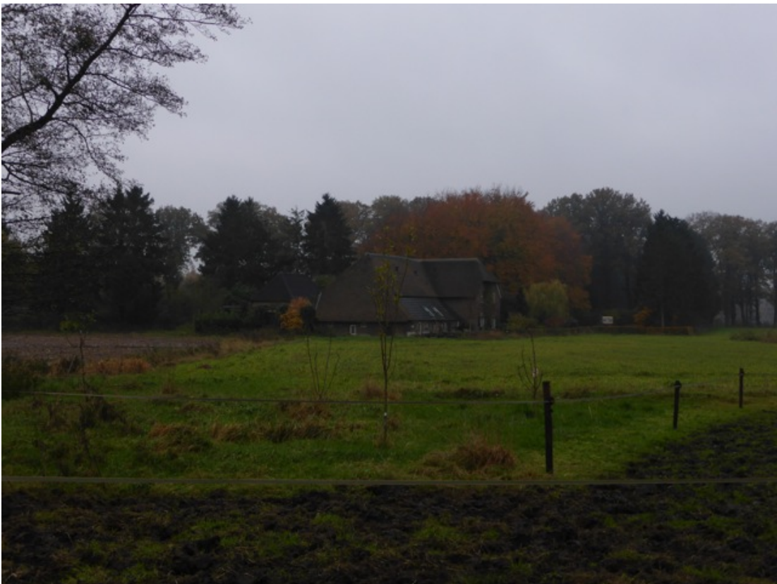
De buren: Aarninksweg 4 gezien vanaf de boerderij. (10)