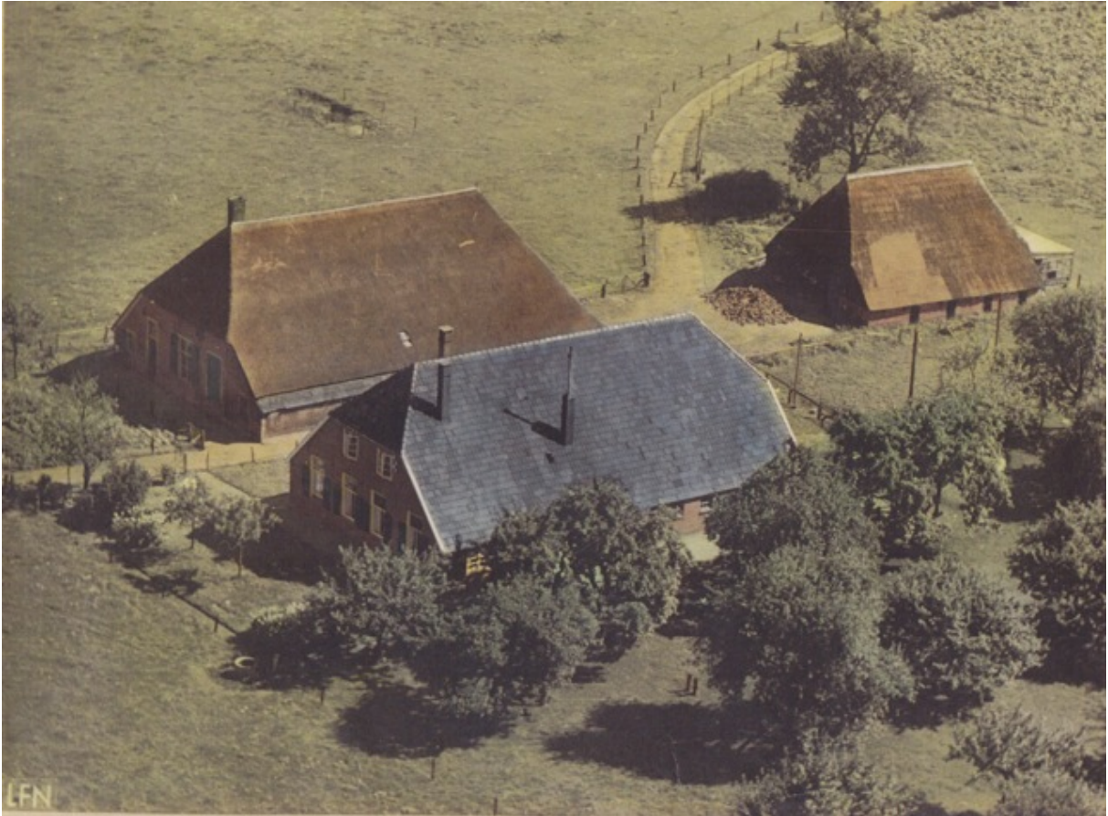
De Aarnink in de jaren '60: 250 jaar bouwhistorie op een erf.