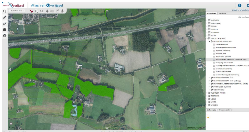
Figuur 4: Ligging plangebied ten opzichte van het NNN.

Het plangebied en de directe omgeving maken geen onderdeel uit van de NNN (figuur 4). Het plangebied ligt op ongeveer 150 meter van begrensd NNN-gebied. Aangezien het plangebied niet in het NNN ligt, is een toetsing aan het NNN-beleid niet noodzakelijk.