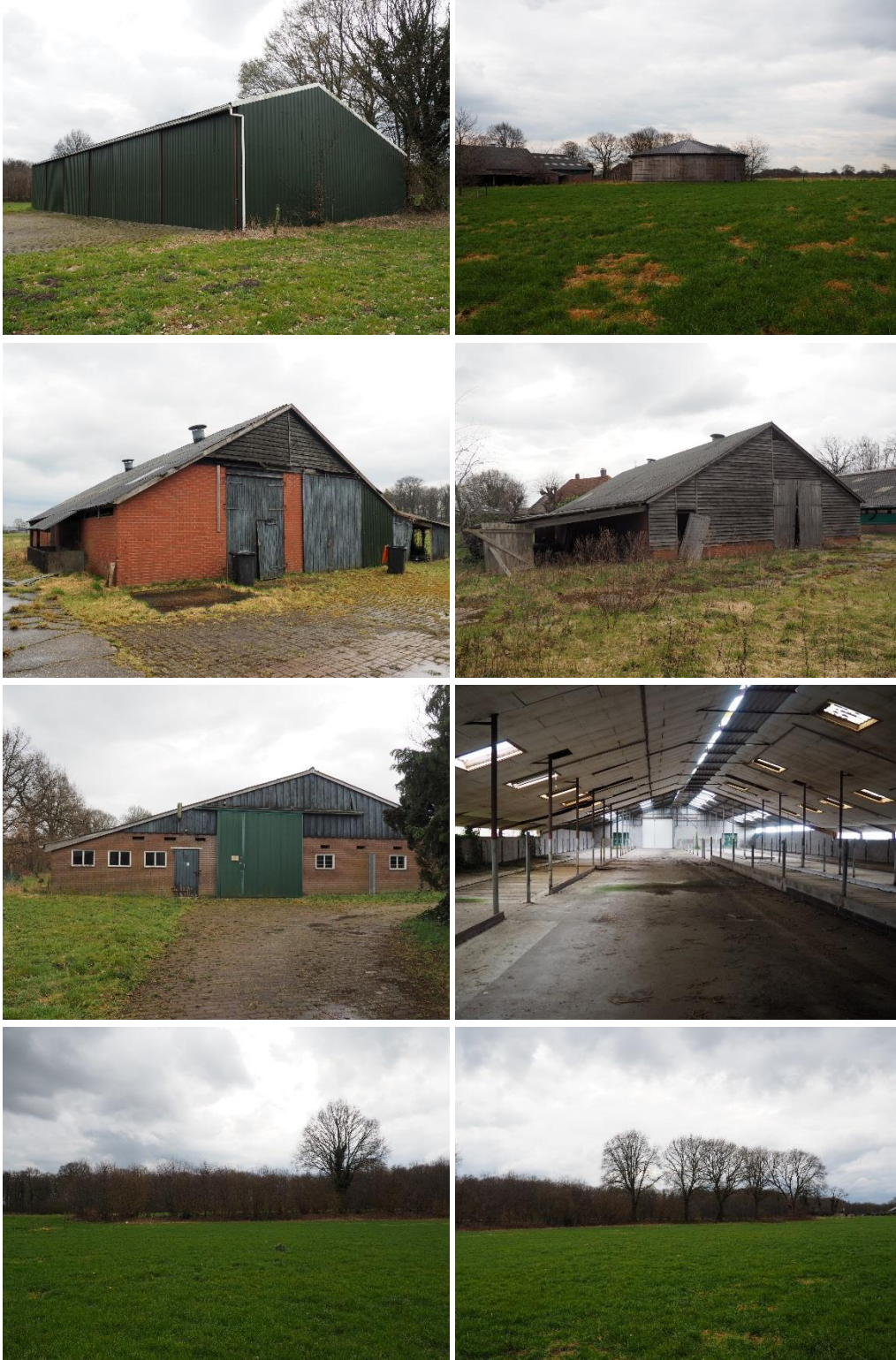
Figuur 2. Impressie plangebied, situatie op 4 april 2018.