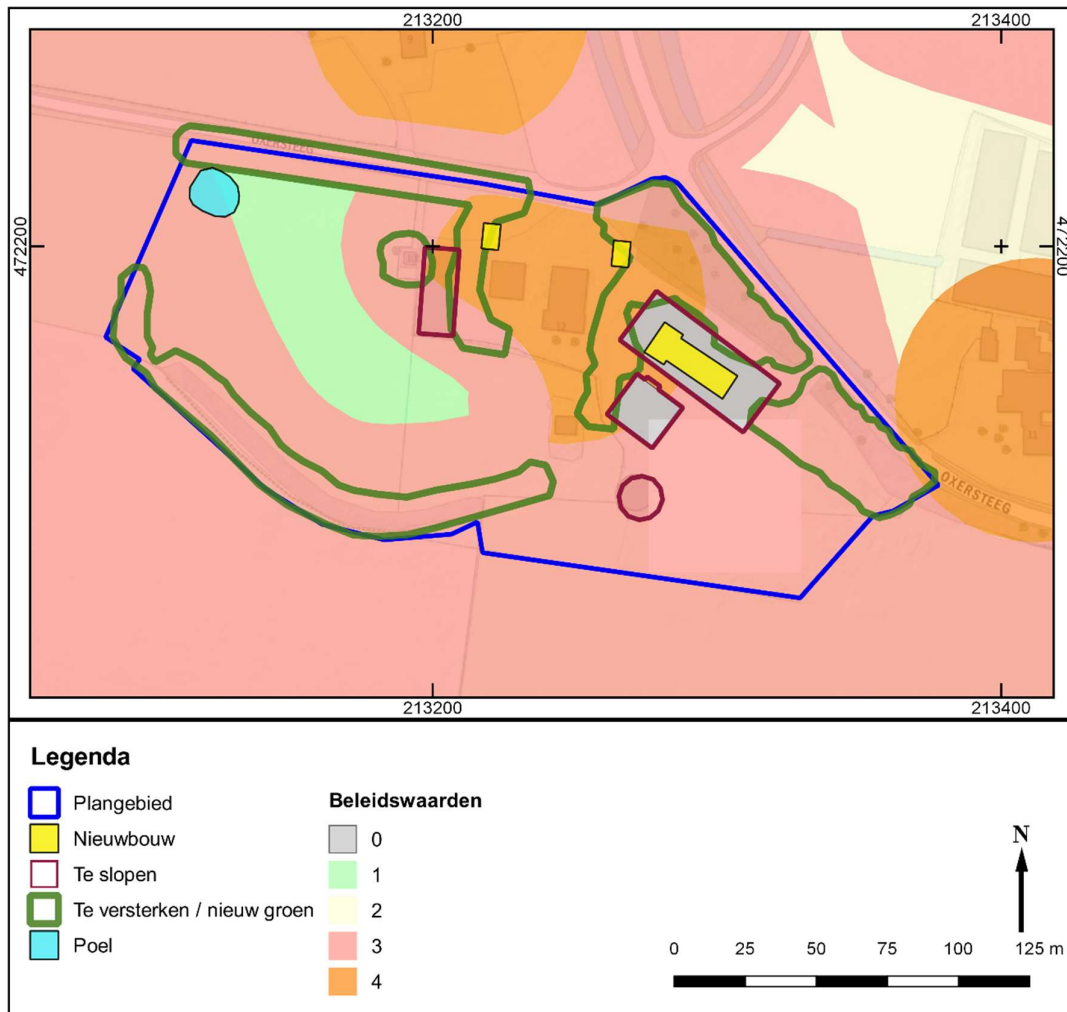
Afb. 2: De voorgenumen plannen ten tijde van de bureaustudie, weergegeven op de archeologische beleidskaart.