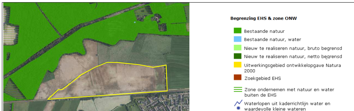
Ligging van Natuurnetwerk Nederland in de omgeving van het plangebied. De begrenzing van het plangebied wordt met de gele lijn aangeduid

Het plangebied ligt net ten zuiden van gronden die tot het Natuurnetwerk Nederland behoren. Gronden die tot het Natuurnetwerk Nederland behoren liggen op minimaal 135 meter afstand van het plangebied. Op onderstaande afbeelding wordt de ligging van het Natuurnetwerk Nederland in de omgeving van het plangebied weergegeven.