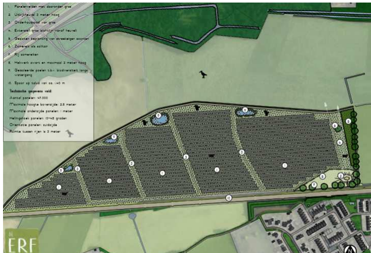
Verbeelding van het wenselijke eindbeeld.

Het voornemen bestaat om het plangebied te ontwikkelen tot zonnepark. In het plangebied worden zonnepanelen geplaatst. Deze panelen zijn niet hoger dan 2,5 à 3 meter. Langs de noordzijde van het plangebied worden enkele amfibieënpoelen aangelegd en langs de oostrand en in de zuidoosthoek wordt beplanting aangelegd. Op onderstaande afbeelding wordt een verbeelding van de nieuwe situatie gegeven.