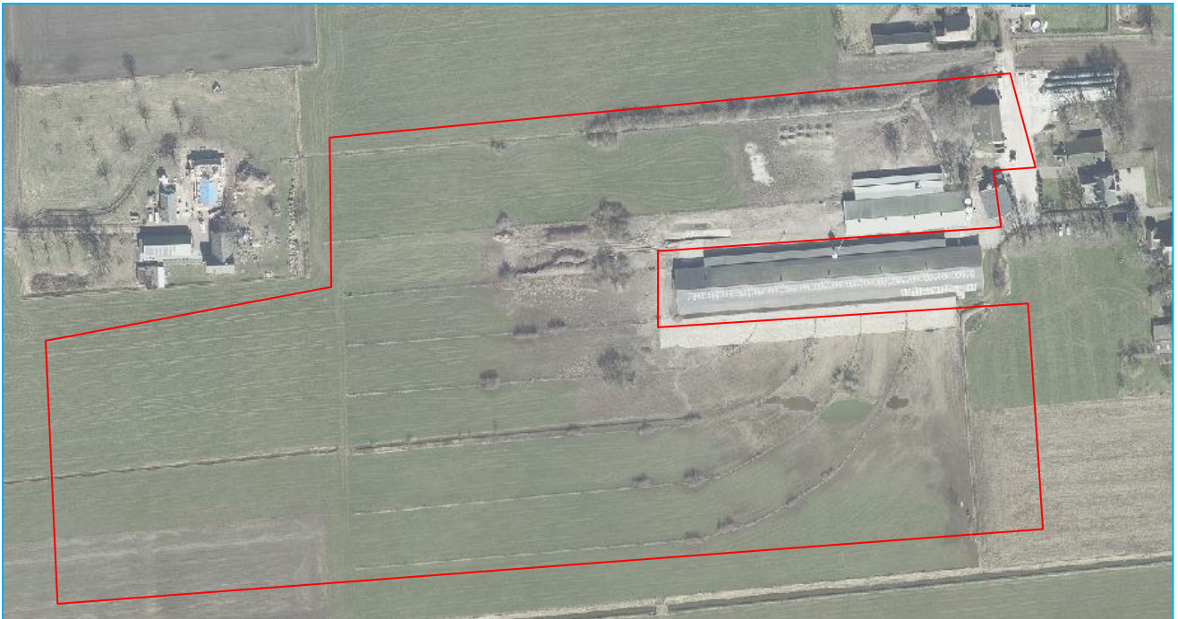
Afbeelding 1: Situering plangebied.

De directe omgeving bestaat uit agrarische percelen en het landgoed Dorth.