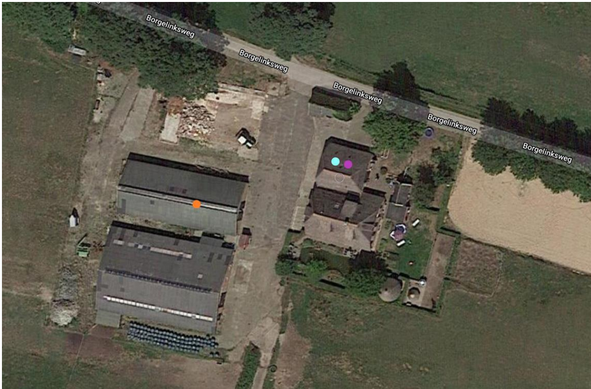
Figuur 3: Nestplaats en slaapplaats van huismus (groen), nestplaatsen van boerenzwaluw (paars) en nestplaats van kerkuil (oranje).