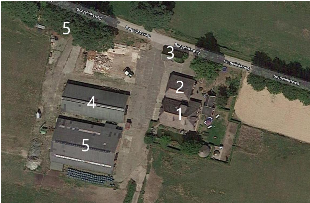
Figuur 1. Een overzicht van het plangebied met woonboerderij (1), karakteristiek bijgebouw (2), kapschuur (3), kalverstal (4), ligboxenstal (5) en hooiberg (6).