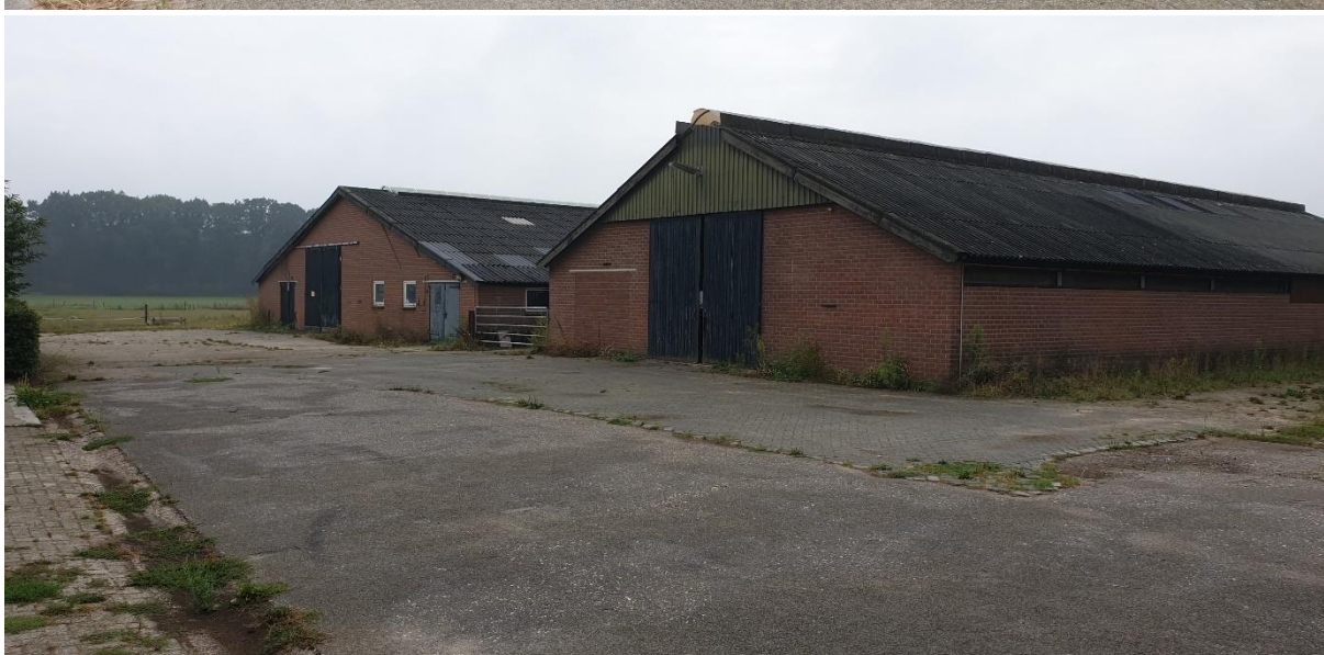
Foto's: boven een impressie van het karakteristiek bijgebouw; midden een impressie van de kapschuur; onder een impressie van rechts de kalverstal en links de ligboxenstal.