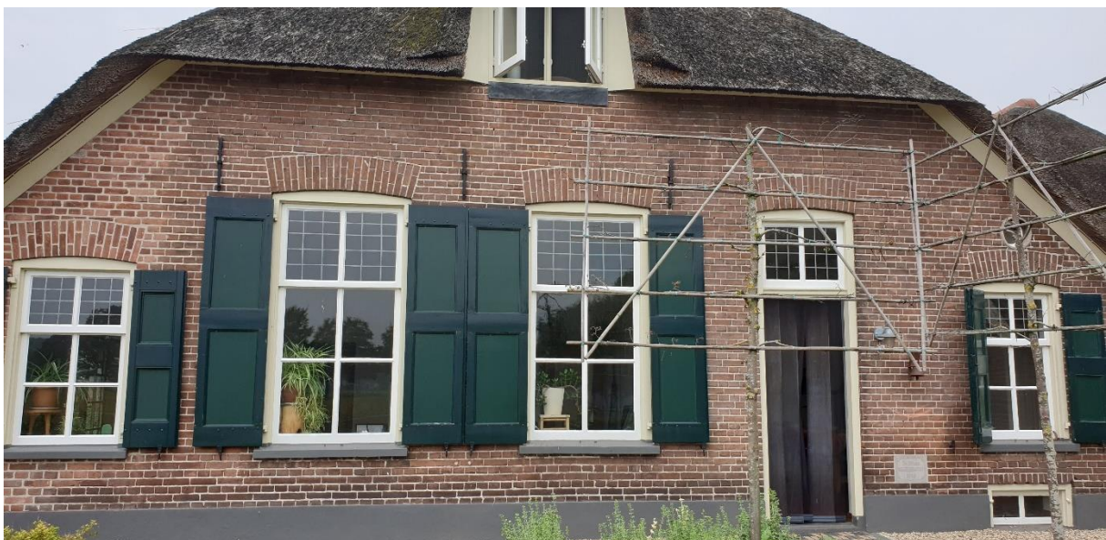
Foto: impressie van de karakteristieke Sallandse woonboerderij