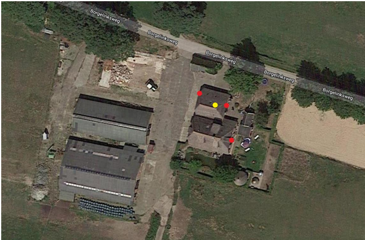
Figuur 2: Drie zomerverblijfplaatsen van gewone dwergvleermuis (rood) en één verblijfplaats van gewone grootoorvleermuis (geel).