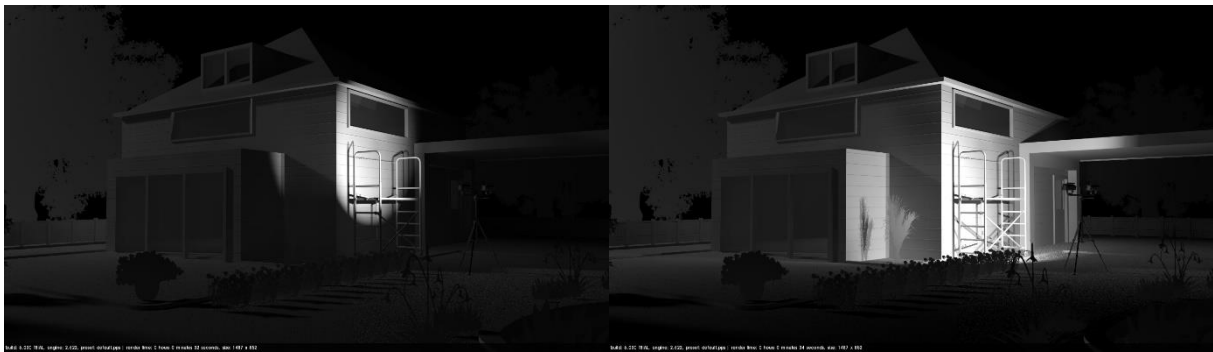
Figuur 3. Gericht licht vs. verstrooid licht

Nachtactieve diersoorten zijn vaak erg gevoelig voor licht, er wordt dan ook geadviseerd om tijdens de werkzaamheden en in de eindsituatie rekening te houden met deze dieren. Dit kan worden gedaan door zo min mogelijk gebruik te maken van verlichting en indien verlichting noodzakelijk is strooilicht zo veel mogelijk te beperken en lichten waar mogelijk te dimmen (fig. 3). Tevens wordt geadviseerd om werkzaamheden niet in het donker of tijdens de schemerperiode uit te voeren.