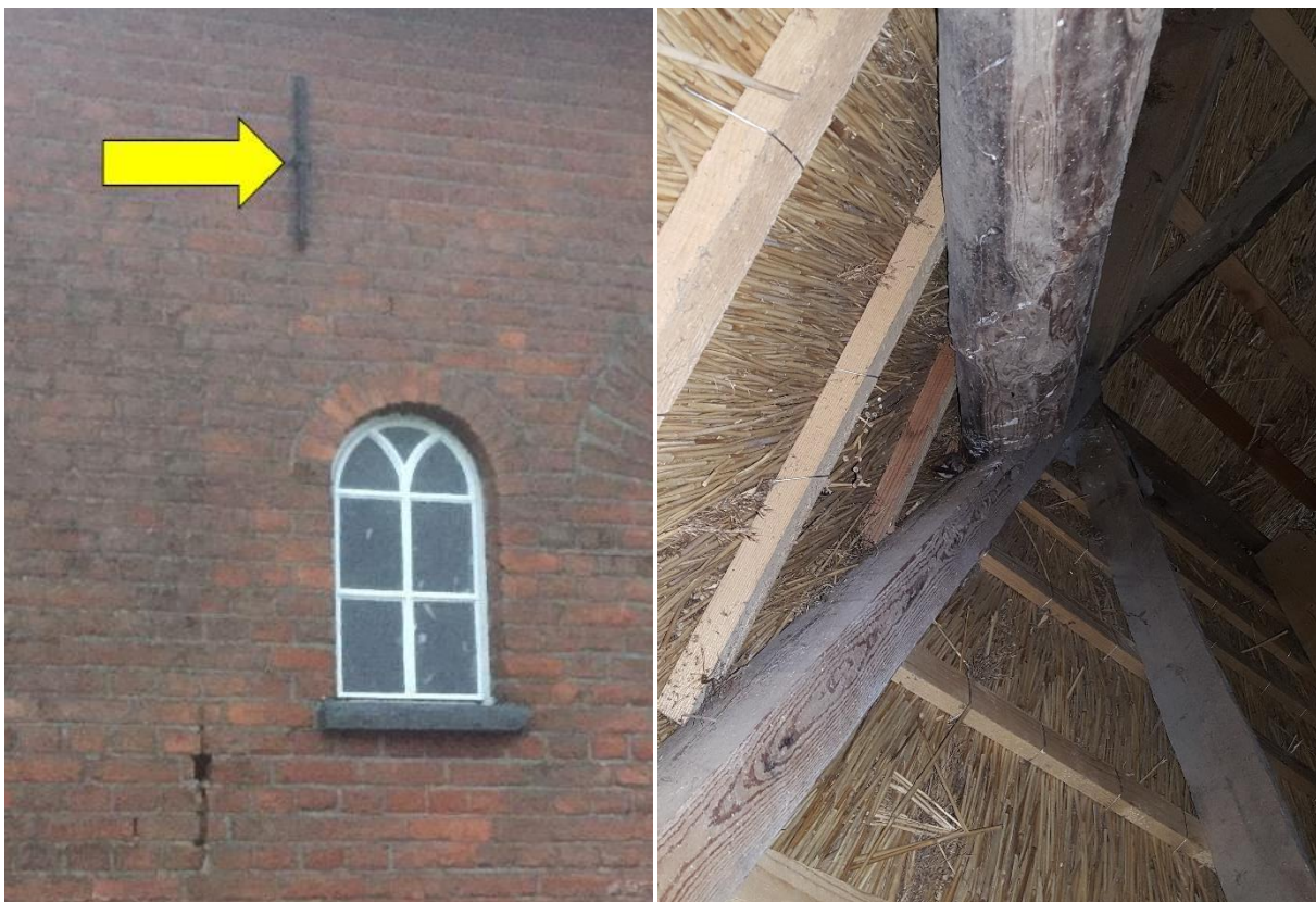
Foto's: Links zomerverblijfplaats van één gewone dwergvleermuis achter een muuranker; rechts zomerverblijfplaats van één gewone grootoorvleermuis op de zolder van het bijgebouw