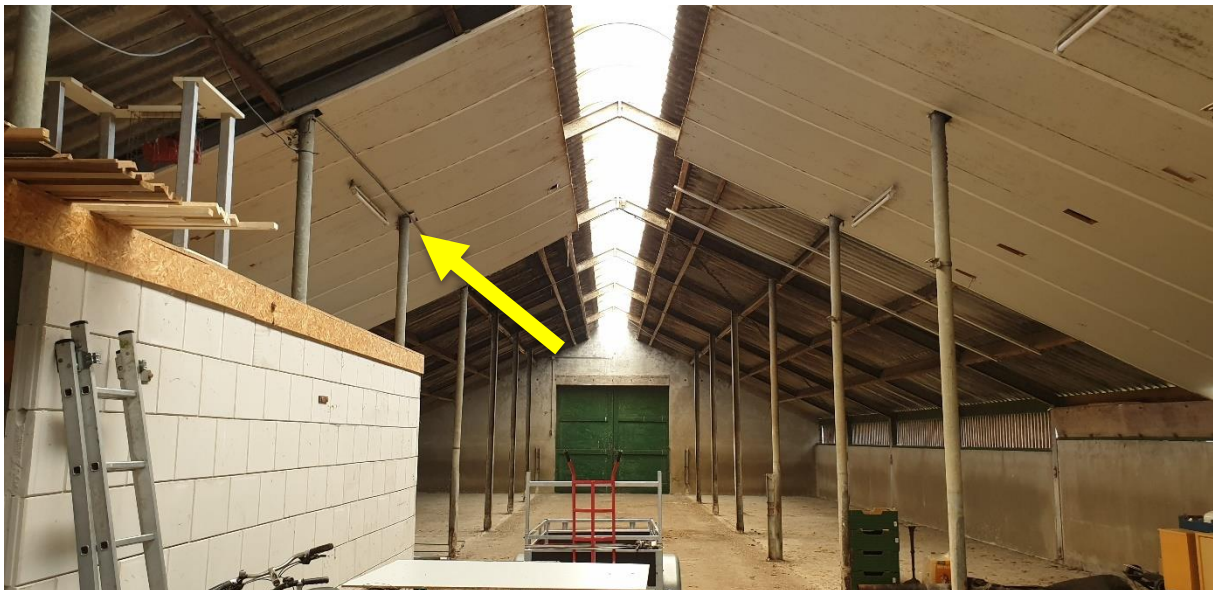
Foto: locatie van nestgelegenheid van kerkuil achter het dakbeschot in de leegstaande kalverstal

Tijdens de veldbezoeken zijn geen indicaties gevonden van de aanwezigheid van gierzwaluw en steenuil in het plangebied. Wel is de aanwezigheid van boerenzwaluw, huismus en kerkuil vastgesteld op het erf aan de Borgelinksweg 1 (fig. 3). Boerenzwaluw is eveneens een erfvogel en zij broeden in het karakteristieke bijgebouw. Ook huismussen broeden in de paardenstal van het karakteristieke bijgebouw. In totaal zijn er een zestal nestkommen van boerenzwaluw en drie nesten van huismus aangetroffen plus aanvullend een nestlocatie van huismus bevindt zich in de gevel van de karakteristieke woonboerderij. In het dakbeschot van de kalverstal bevindt zich een kerkuil waar volgens de bewoners eerder dit jaar ook een nest kerkuilen is groot gebracht. De toegang tot de nestruimte bevindt zich ter hoogte van een ijzeren paal (zie foto). Sporen van kerkuil zoals veren, braakballen en krijstreden zijn hier in overvloed te vinden.