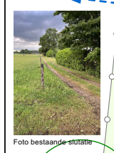
Foto bestaande situatie