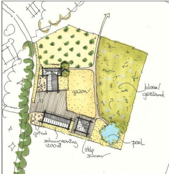
Verbeelding van het wenselijke eindbeeld.

Het voornemen bestaat de opstallen in het plangebied te slopen en een nieuwe woning en schuur te bouwen aan de zuidzijde van het erf. Tevens wordt een poel aangelegd. Een deel van de erfverharding zal verwijderd worden. Op onderstaande afbeelding wordt een verbeelding van het wenselijke eindbeeld weergegeven.