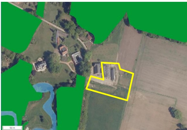
Ligging van Natuurnetwerk Nederland in de omgeving van het plangebied. De begrenzing van het plangebied wordt met de gele lijn aangeduid. Gronden die tot Natuurnetwerk Nederland behoren worden met de groene en blauwe kleur op de kaart aangeduid.

Het plangebied ligt op minimaal 20 meter afstand van gronden die tot Natuurnetwerk Nederland behoren. Op onderstaande afbeelding wordt de ligging van Natuurnetwerk Nederland in de omgeving van het plangebied weergegeven.