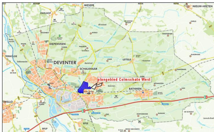
Globale ligging plangebied Colmschate-West

Het gebied wordt ontsloten via de N348, Holterweg, de Leonard Springerlaan en de In de volgende figuur is de globale ligging van het plangebied aangegeven.