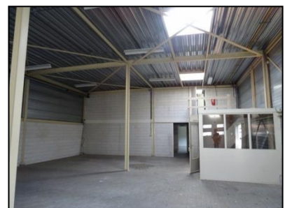
Figuur 8. Binnenzijde van de loods.