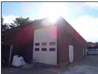
Figuur 3. Loods met roldeur, gezien vanuit het noordwesten.