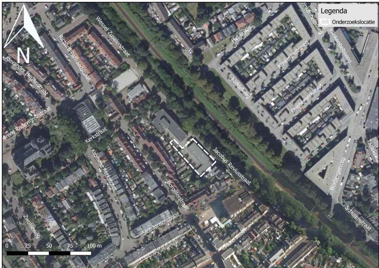
Figuur 2. Luchtfoto onderzoekslocatie en directe omgeving.