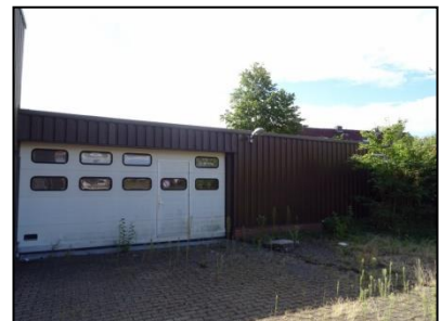
Figuur 5. Garage ten zuiden van de loods.