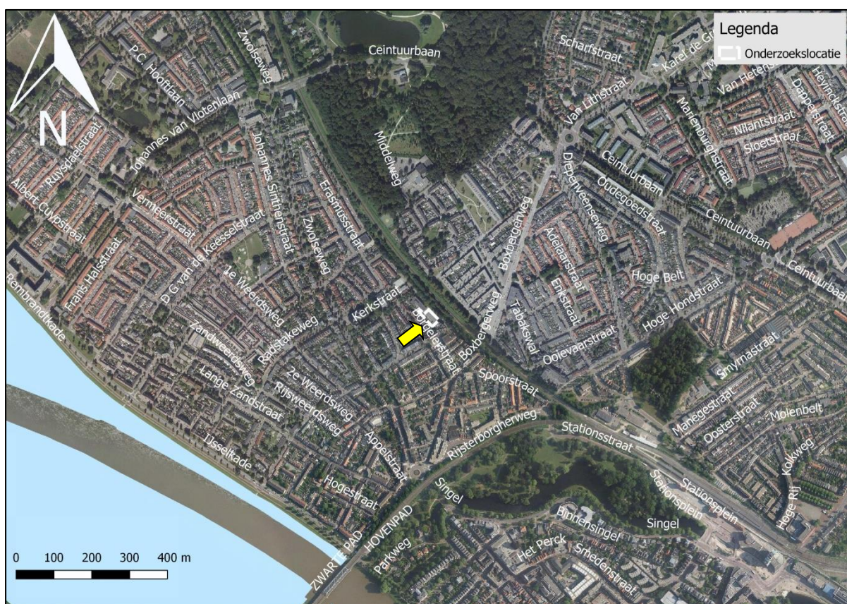
Figuur 9. Ligging onderzoekslocatie ten opzichte van Natura 2000.

De onderzoekslocatie is niet gelegen binnen de grenzen, of in de directe nabijheid van een gebied dat aangewezen is als Natura 2000. Het meest nabijgelegen Natura 2000-gebied bevindt zich op circa 650 meter afstand ten zuidwesten van de onderzoekslocatie (zie figuur 9).