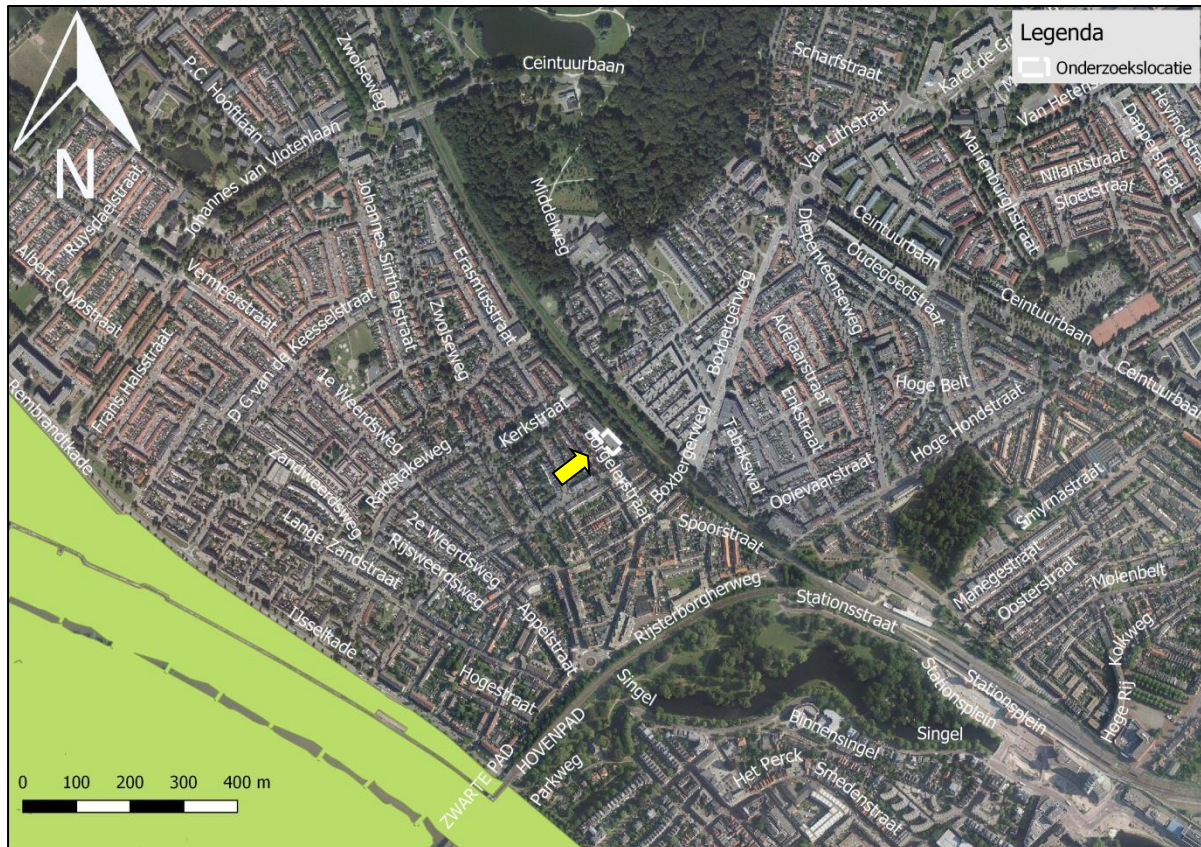
Figuur 10. Ligging onderzoekslocatie ten opzichte van het Natuurnetwerk Nederland.

De onderzoekslocatie maakt geen deel uit van het Natuurnetwerk. De onderzoekslocatie ligt ook niet in de nabijheid van een gebied, behorend tot het Natuurnetwerk Nederland. Het meest nabijgelegen gebied bevindt zich circa 600 meter ten zuidwesten van de onderzoekslocatie. In figuur 10 is de ligging van de onderzoekslocatie ten opzichte van het Natuurnetwerk Nederland weergegeven.