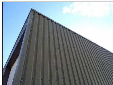
Figuur 4. Damwandprofielen van loods.