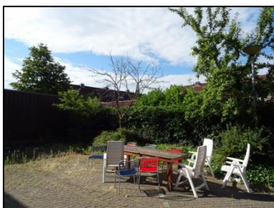
Figuur 6. Teunmeubilair en groen.