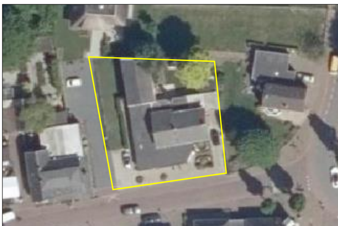
Begrenzing van het plangebied; deze wordt met de gele lijn aangeduid.

Het plangebied bestaat uit bebouwing, beplanting, gazon en erfverharding. De bebouwing bestaat uit een winkelpand, een bedrijfswoning, een bedrijfsgebouw en een houten schuur. Het winkelpand staat tegen de noord- en westzijde van de bedrijfswoning gebouwd. De houten schuur staat tegen de oostzijde van de bedrijfswoning gebouwd en het bedrijfsgebouw staat ten noorden van de bedrijfswoning. De bedrijfswoning, het winkelpand en het bedrijfsgebouw beschikken over gemetselde buitengevels met luchtspouw. De buitengevels van het winkelpand bestaan voornamelijk uit kozijnen met glas en zijn deels met hout betimmerd. De bedrijfswoning en het bedrijfsgebouw beschikken over een dakpannen gedekt zadeldak. De schuur is volledig van hout en het winkelpand en de schuur beschikken over een plat dak. In het noordelijke en oostelijke deel van het plangebied ligt gazon en de beplanting bestaat uit sierplanten, hagen (laurier en conifeer) en enkele loofbomen. Het plangebied grenst met noordzijde aan gazon en erfverharding, met de westzijde aan erfverharding, met de oostzijde aan gazon en met de zuidzijde aan de Dorpsstraat. Op onderstaande luchtfoto is de begrenzing van het plangebied aangegeven. Voor een verbeelding van de huidige situatie wordt verwezen naar de fotobijlage.