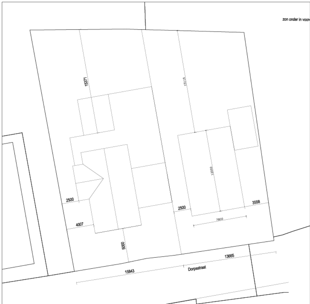
Plattegrond van het wenselijk eindbeeld.

Het voornemen bestaat om een nieuwe woning met bijgebouw in het plangebied te realiseren. Om deze nieuwbouw te realiseren dient de bestaande bebouwing gesloopt te worden. Aangenomen wordt dat alle aanwezige beplanting verwijderd wordt. Tevens wordt aangenomen dat een deel van de bestaande erfverharding verwijderd en vervangen wordt en dat er nieuwe erfverharding wordt aangelegd. Het nieuwe erf wordt nadien landschappelijk ingepast, middels de aanplant van erfbeplanting. Op onderstaande afbeelding wordt een plattegrond van het wenselijk eindbeeld weergegeven.