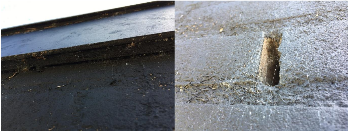
Foto links; kieren tussen de buitengevels en de houtbetimmering van het winkelpand vormen een potentiële verblijfplaats voor vleermuizen. Foto rechts; de open stootvoegen zijn gevuld met spinrag.

Verder zijn geen potentiële verblijfplaatsen van vleermuizen waargenomen, zoals een holle ruimte achter een boeiboord, windveer, loodslab, vensterluik, zonnewering of gevelbetimmering aangetroffen. In het plangebied zijn geen bomen met holen of loshangend schors aanwezig.