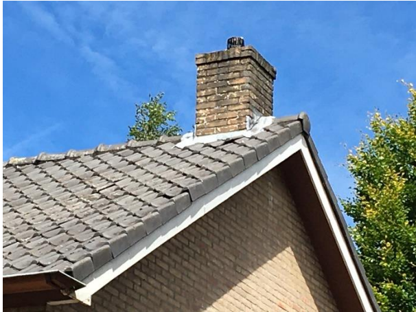
De ruimtes onder de dakpannen vormen een potentiële nestplaats voor huismussen.

Door het verwijderen van beplanting en het slopen van de bedrijfswoning en het bedrijfsgebouw tijdens de voortplantingsperiode, wordt mogelijk een vogel gedood en een bezet vogelnest beschadigd of vernield. Als gevolg van het uitvoeren van de voorgenomen activiteiten neemt de betekenis van het plangebied als foerageergebied voor vogels niet af.