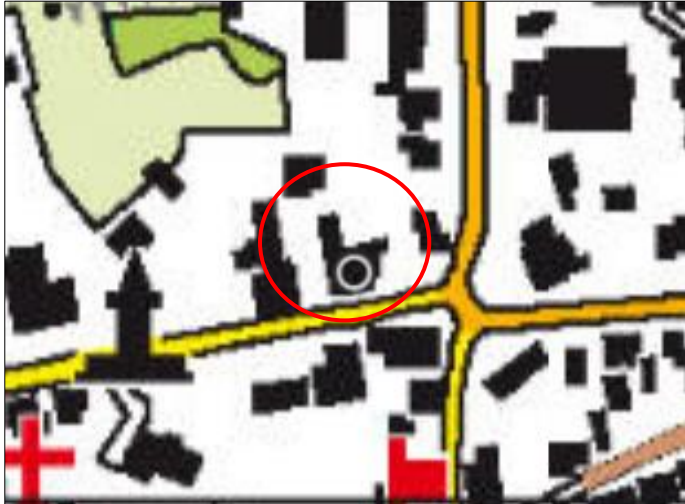
Globale ligging van het plangebied. De ligging van het plangebied wordt met de rode cirkel aangeduid.

Het plangebied is gesitueerd aan de Dorpsstraat 2 te Bathmen, gemeente Deventer. Het ligt in het noordelijke deel van de woonkern Bathmen en wordt omgeven door stedelijk gebied. Op onderstaande afbeelding wordt de globale ligging van het plangebied weergegeven op een topografische kaart.