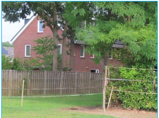
Foto's: Indrukken directe omgeving. De te handhaven woning op het perceel en buurtwoning.