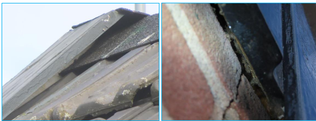
Foto's: Openingen die toegang kunnen bieden naar mogelijke vaste verblijfplaatsen van vleermuizen.

De schuur is geschikt bevonden voor vleermuizen. Zo zijn er diverse openingen, bijvoorbeeld bij de gevelbetimmering, die leiden naar de niet-geïsoleerde spouw. De ruimte tussen de dakpannen en het beschot is geschikt als verblijfplaats voor vleermuizen. Vleermuizen hebben maar hele kleine openingen nodig om binnen te komen.