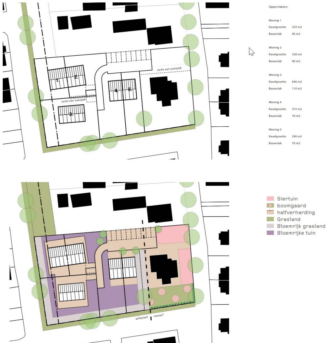
Afbeelding 2: Gewenste toekomstige situatie.

De ingrepen vinden plaats in het kader van ruimtelijke inrichting of ontwikkeling van gebieden.