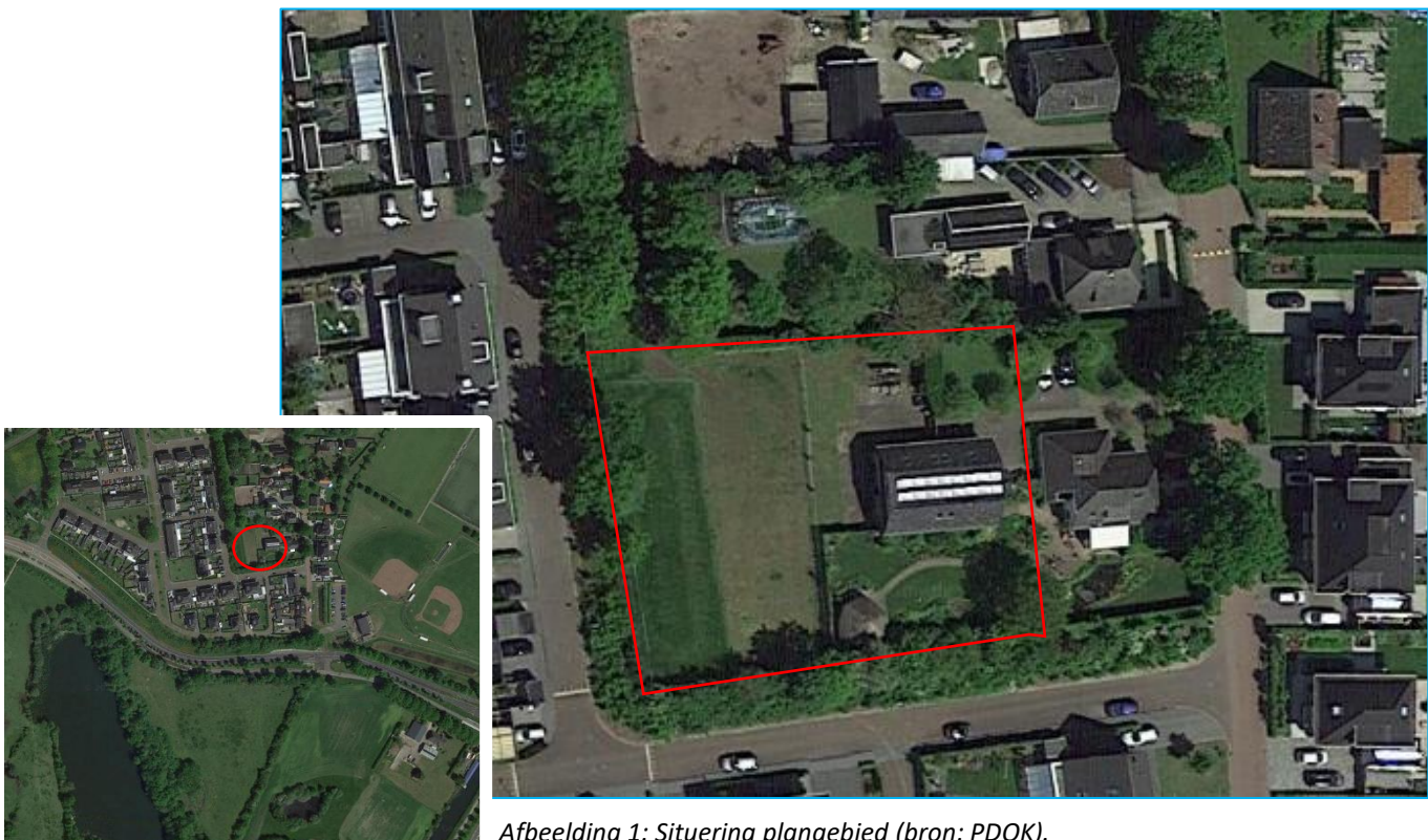
Afbeelding 1: Situering plangebied.

De directe omgeving bestaat uit infrastructuur, groenstructuren en woningen.