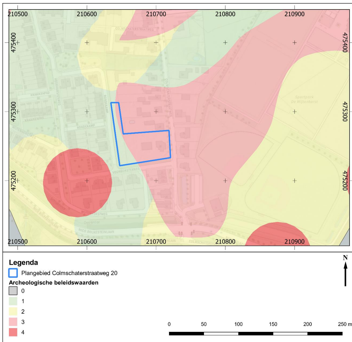
Afb. 2: Plangebied op archeologische beleidskaart gemeente Deventer (2015).