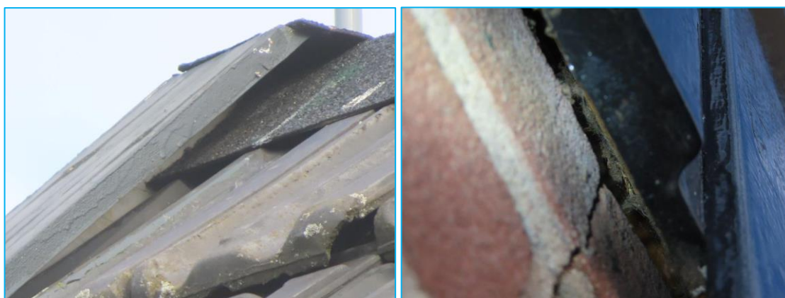
Foto's: Openingen die toegang kunnen bieden naar mogelijke vaste verblijfplaatsen van vleermuizen.

De schuur is geschikt bevonden voor vleermuizen. Zo zijn er diverse openingen, bijvoorbeeld bij de gevelbetimmering, die leiden naar de niet-geïsoleerde spouw. De ruimte tussen de dakpannen en het beschot is geschikt als verblijfplaats voor vleermuizen. Vleermuizen hebben maar hele kleine openingen nodig om binnen te komen.