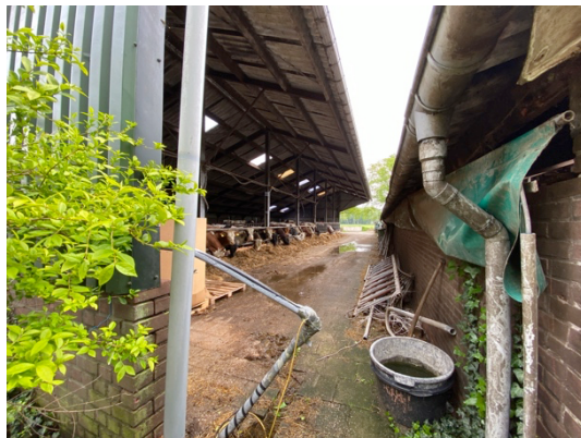
Voormalige melkveestal en kapschuur