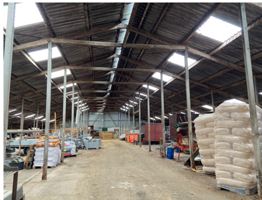
Binnenzijde melkvee- en varkensstal