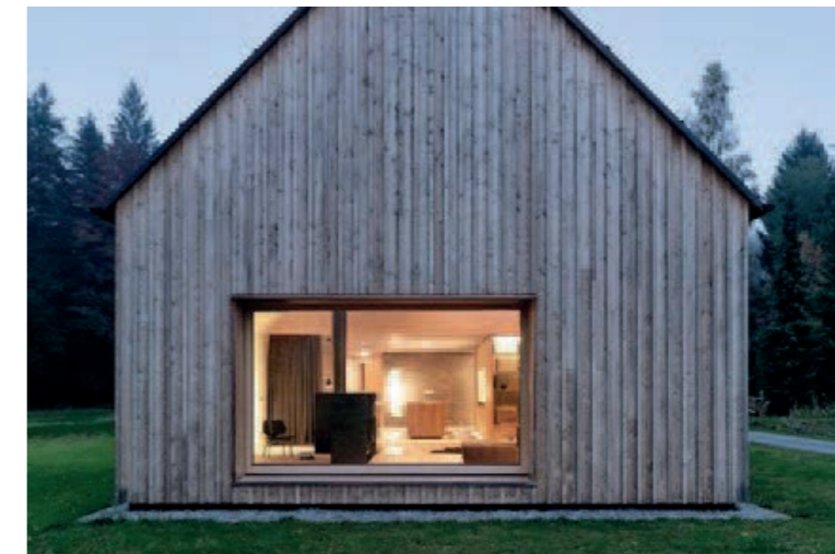
Ingetogen natuurlijke materialen