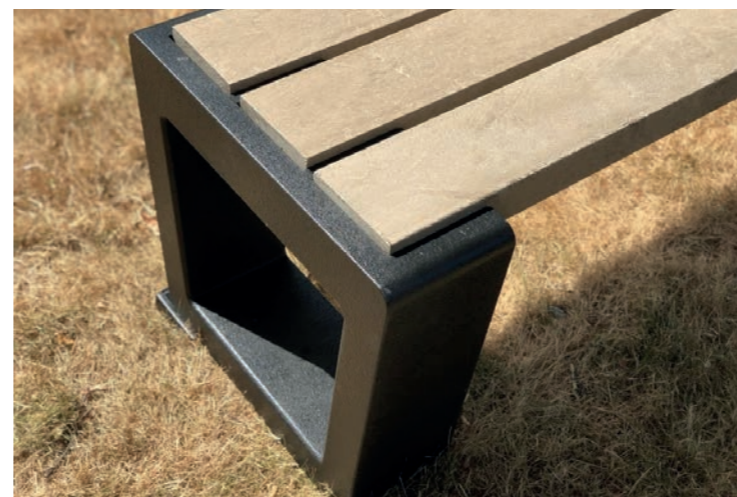
Sfeerimpressie materialisering straatmeubilair