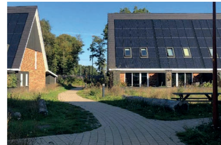
Rug-aan-rugwoningen te gast in het landschap