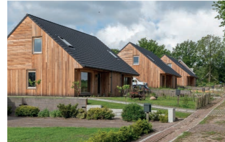
De entree is overdekt en ligt terug ten opzichte van de voorgevel