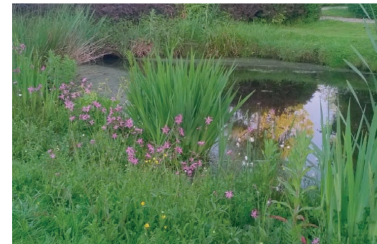
Natuurvriendelijke oever in de overgangszone