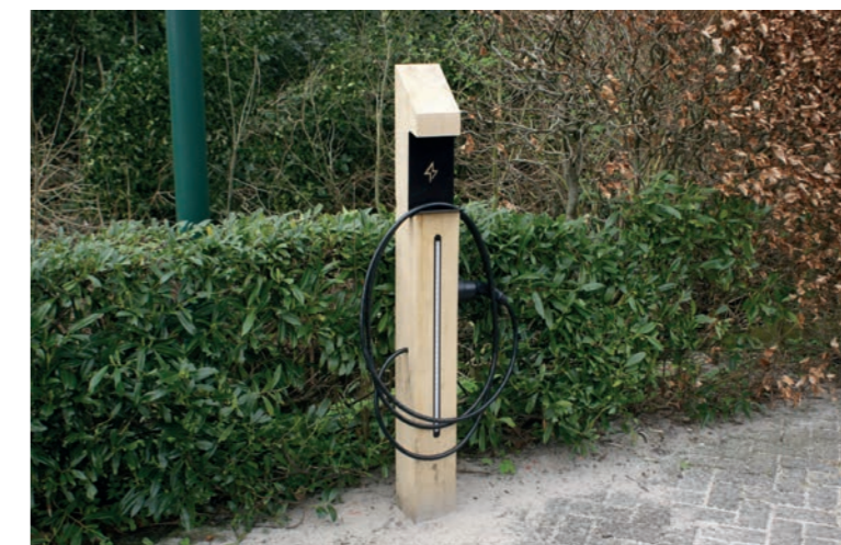
Laadpaalvoorziening in de parkeerkoffers