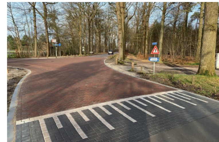
Ontsluiting Oerdijk dmv een verkeerstafel uitgevoerd in een gebakken keiformaat in keperverband