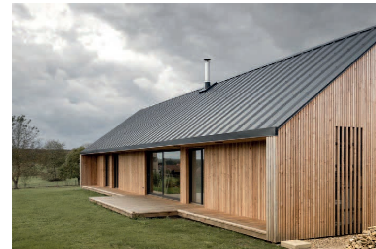
Verbijzondering van de gevel als onderdeel van de architectuur