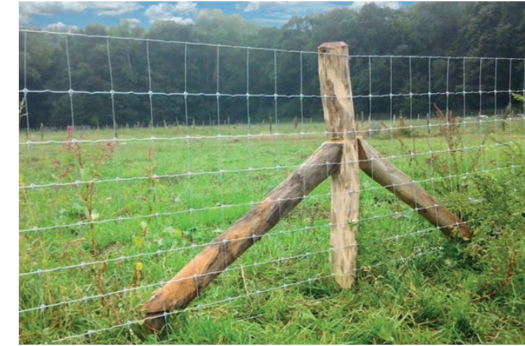
Optionele erfafscheiding moestuinen; Schapengaas met robinia palen