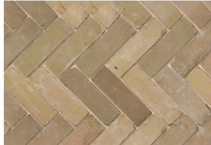
Materiaal ontsluiting noordzijde en voetpaden; Gebakken dikformaat klinker geel genuanceerd