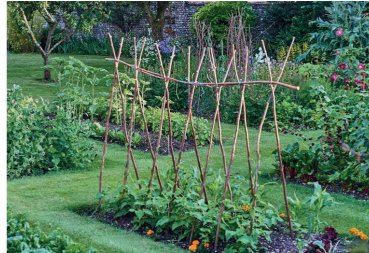
Sfeerimpressie moestuinen met graspaden