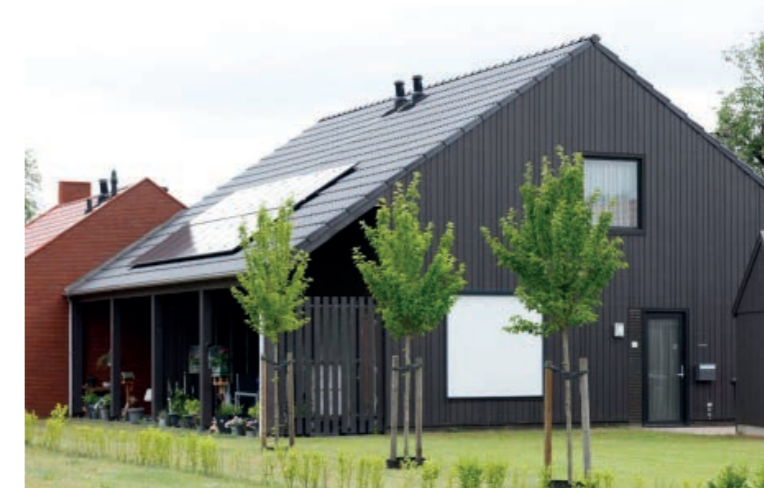
Natuurlijk materiaalgebruik en gedempte kleuren