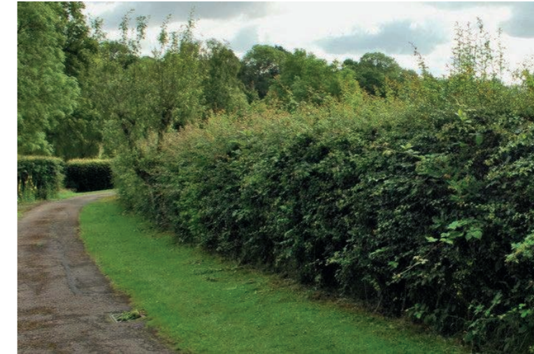
Gemengde haag van ca 1,5 meter hoog