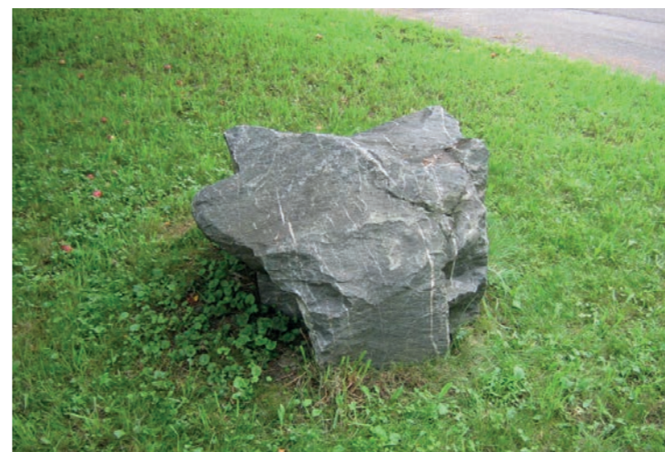
Zwerfkei, markering langs parkeervakken