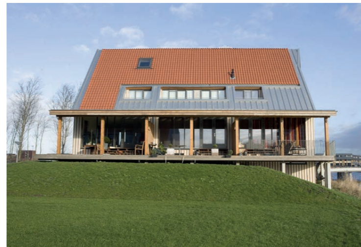
Veranda aan het landschap