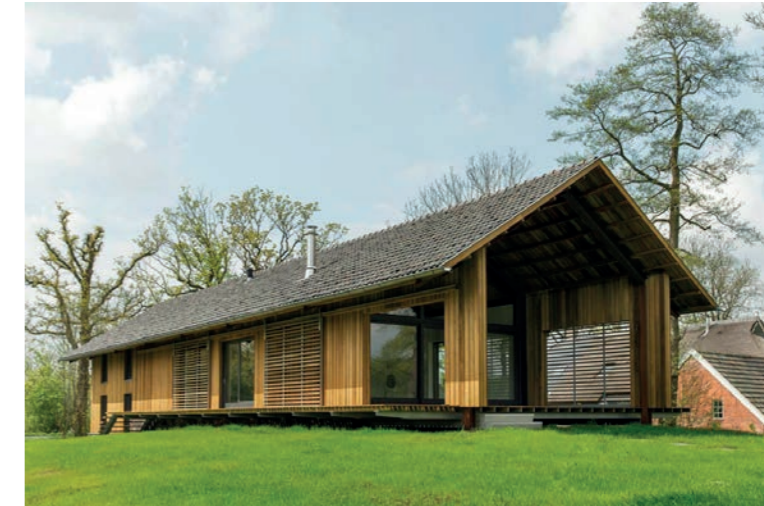
Alzijdige uitstraling en representatie