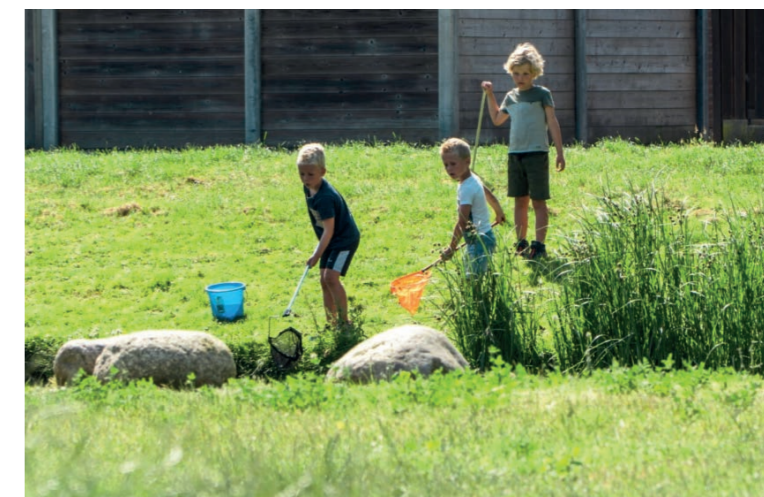
Natuurlijke speelaanleidingen in de zone tussen het noordelijk en zuidelijk plangebied