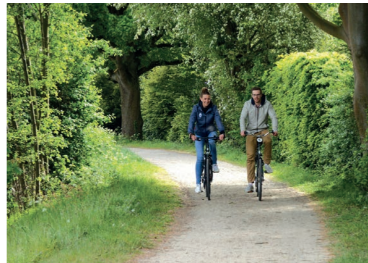
Sfeerimpressie ontsluiting noordzijde