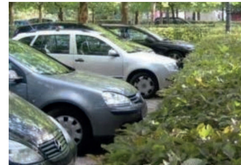
Parkeerkoffers omzoomd met hagen