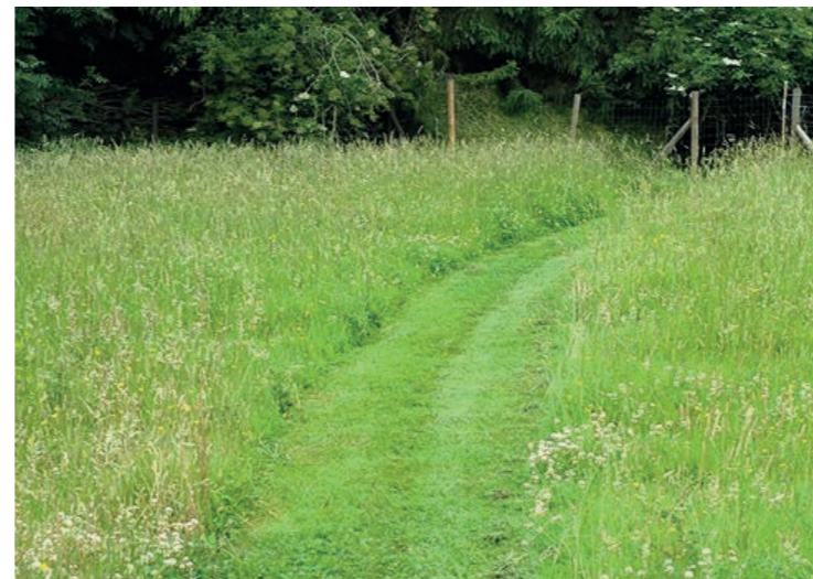
Struinroute, uitgemaaid graspad