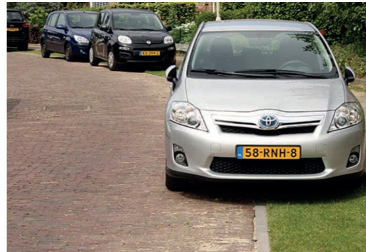
Langsparkeren in de berm