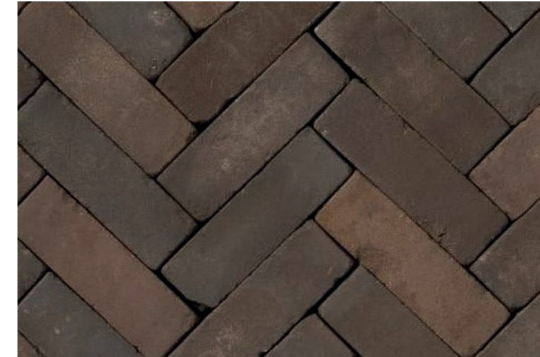
Straatklinker; Gebakken klinker bruin genuanceerd in keperverband