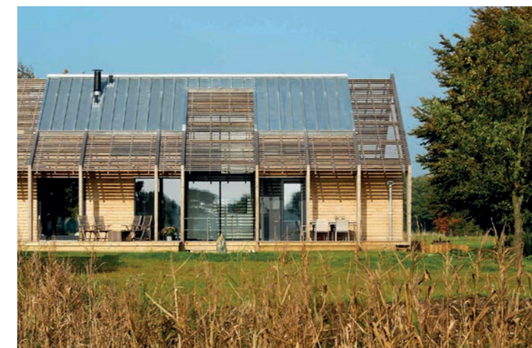
Zachte overgang tussen woning en landschap