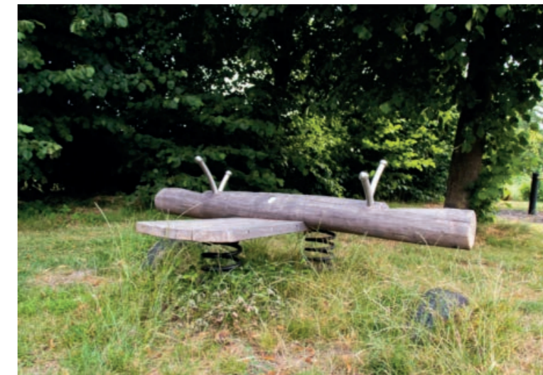
Natuurlijk spelen voor 2-6 jaar