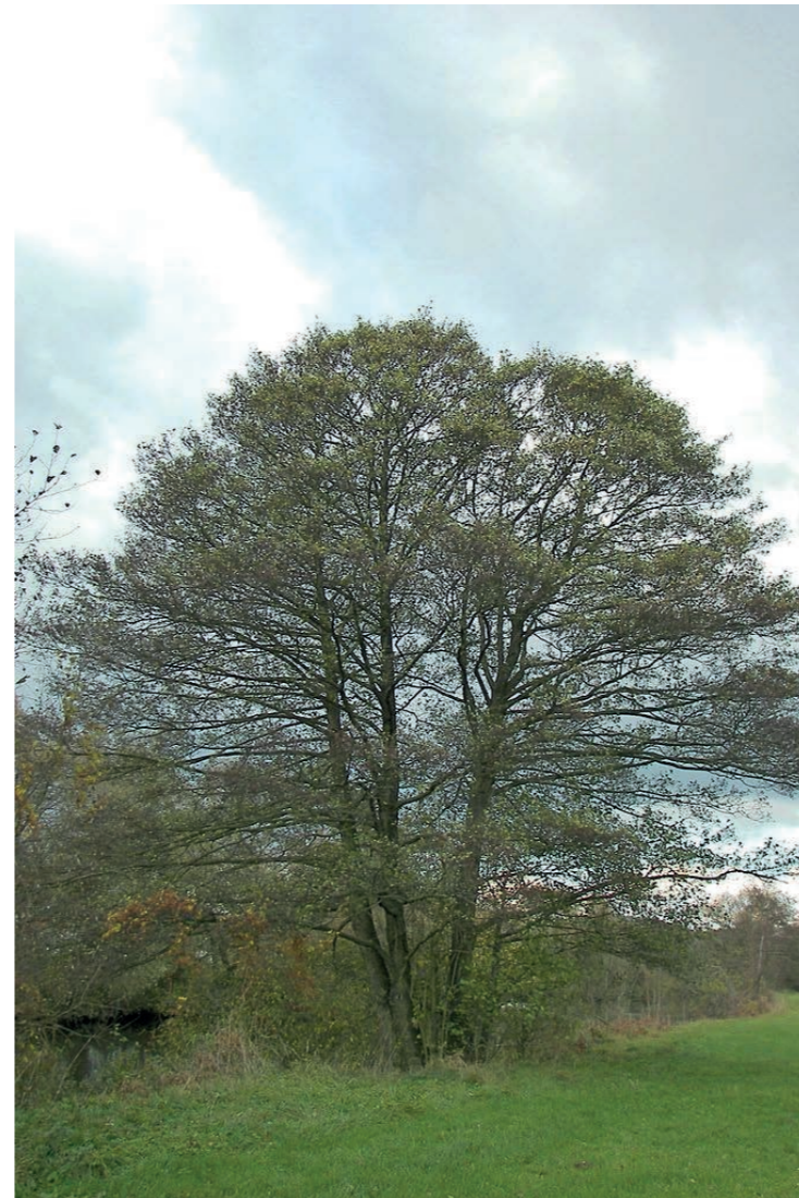
Zwarte Els op de insteek van de watergang