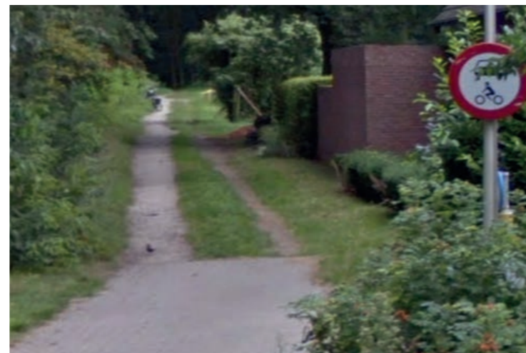
Ontsluiting Sportlaan ter hoogte van het zandpad