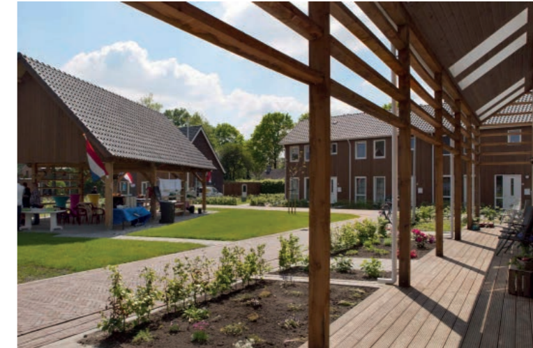
Veranda's als zone tussen privé en openbaar