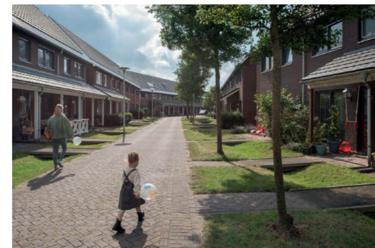
De woningen krijgen een voorstoep/voortuinzone aan de voorzijde