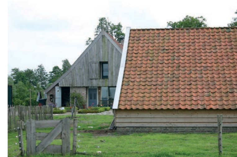
Aanzicht dakvlak groter dan gevelvlak