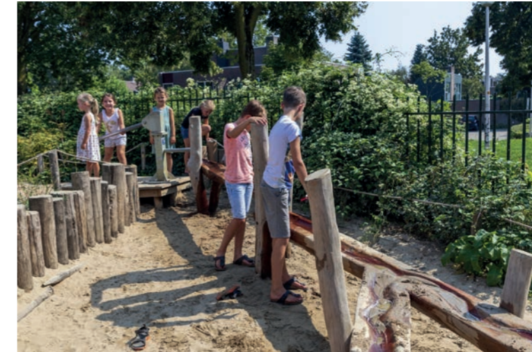
Connectie met de locatie, waterspelen in het zuidelijke plangebied