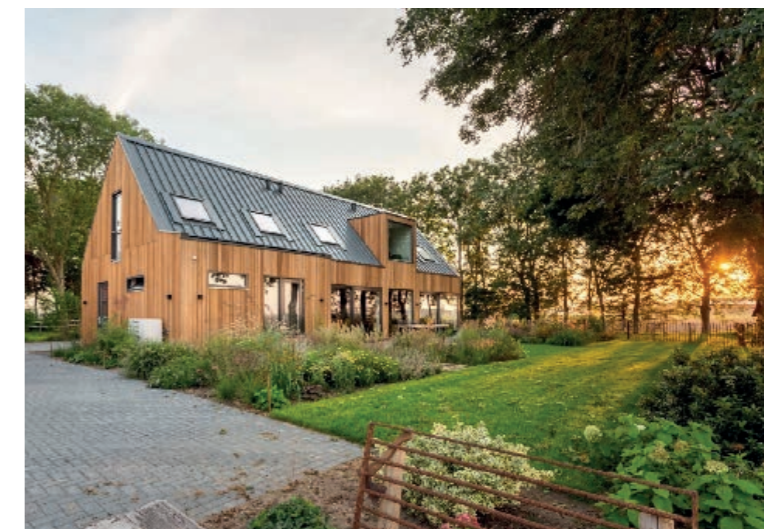
Beperkt palet aan materialen en verbijzondering in samenhang met de architectuur