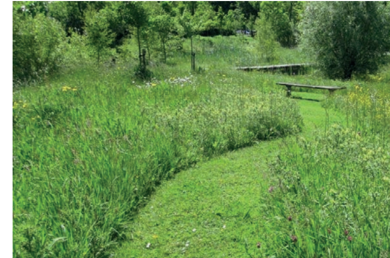
Struinroute met bankje