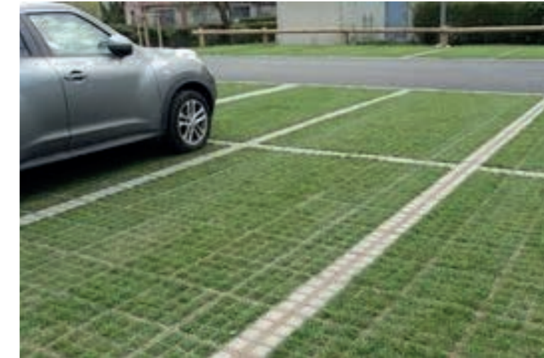
Voorbeeld uitwerking van o2D Green grasroosters