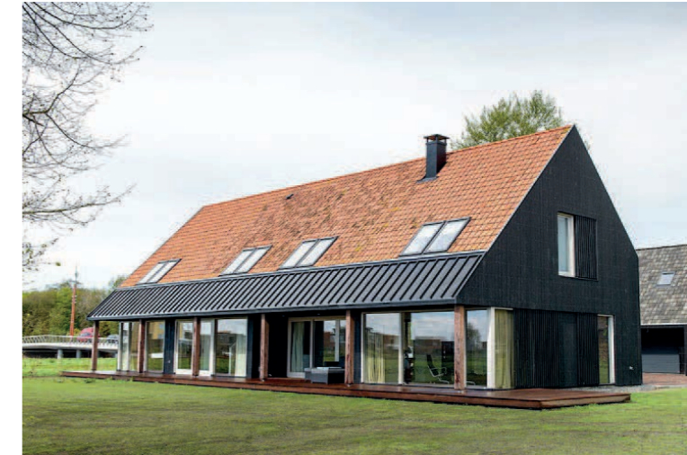
Materialen dragen bij aan de eenvoud van de vorm