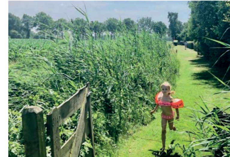
Struinroute - ontsluiting van de achtertuinen