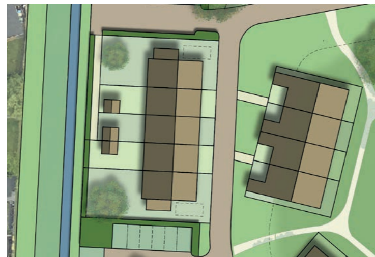
Rijwoningen met tuin