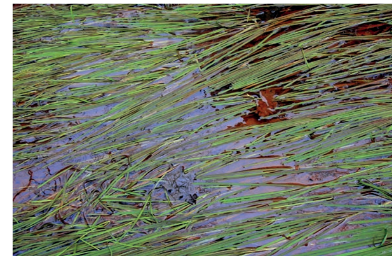
Beeld infiltratiezone in natte perioden