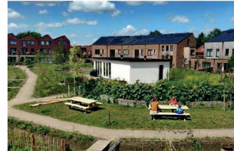
Wonen aan de moestuin