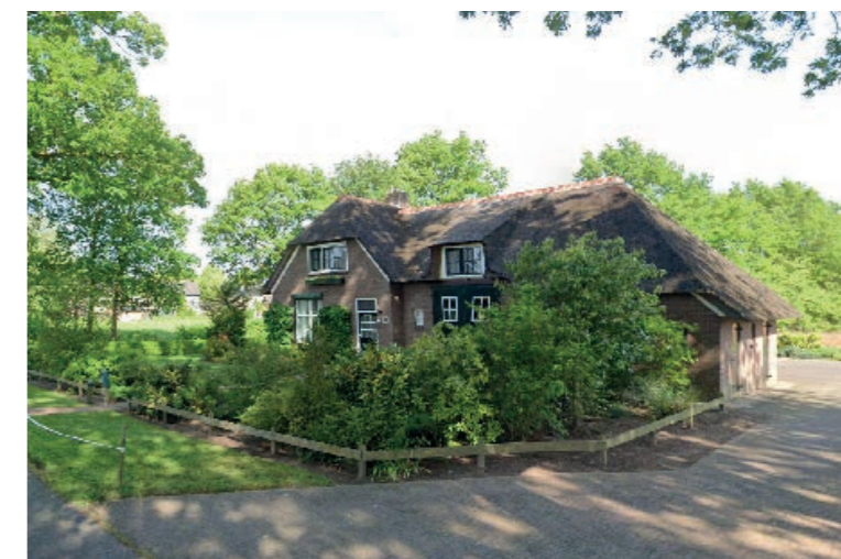
Erfbebouwing aan de Oerdijk