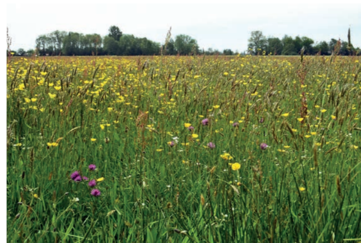
Zomers beeld groenblauwe kom