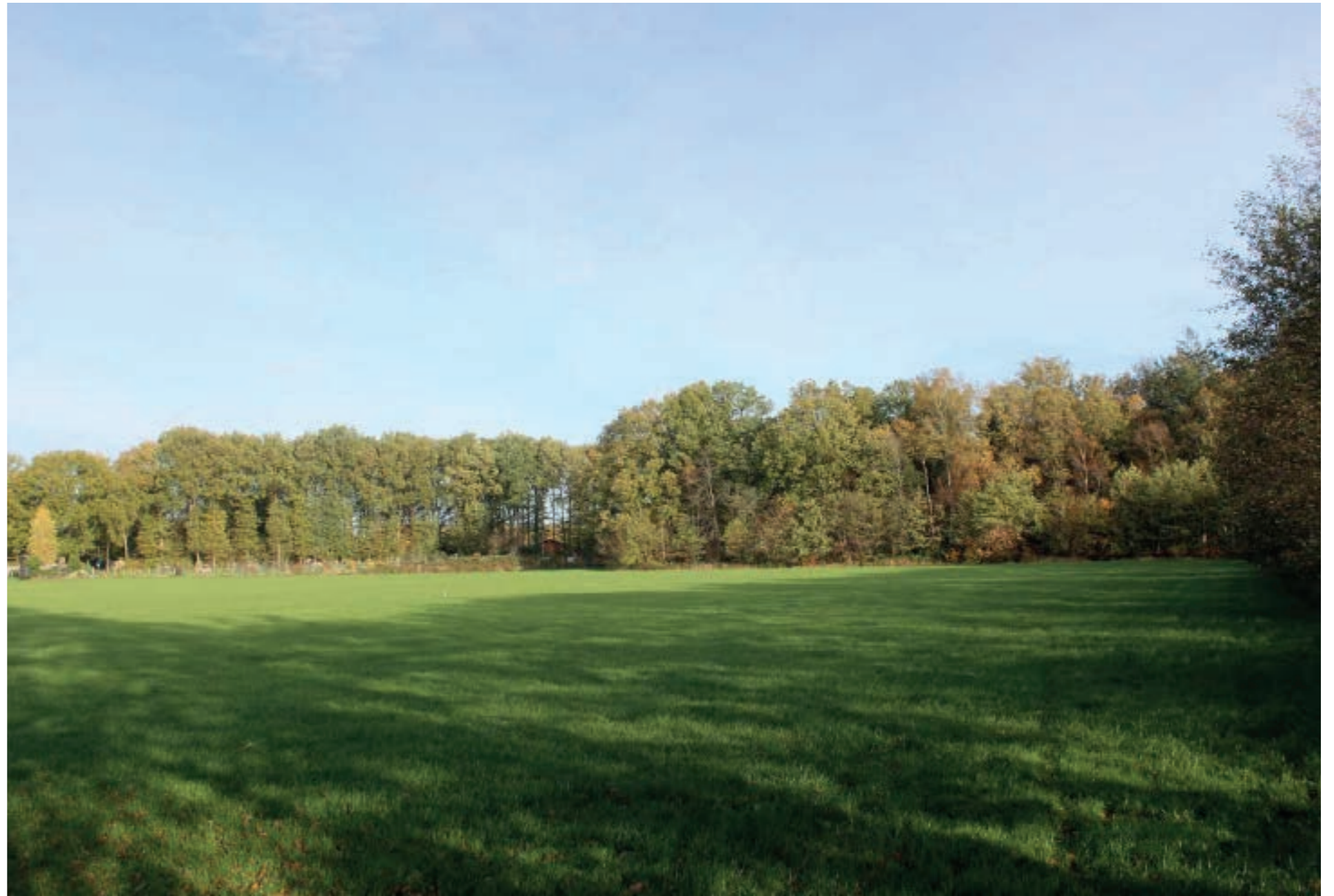
Foto's plangebied met open landschap, moestuinen en bosrand