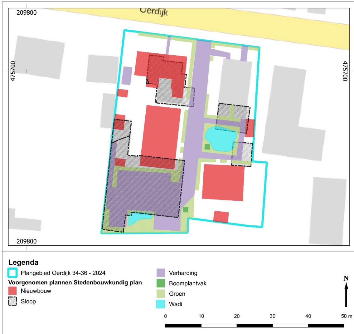
Afb. 2: Het plangebied met de voorgenomen ingrepen, zoals bekend op het moment van schrijven

Zodra de plannen concreter zijn, dienen deze opnieuw getoetst te worden aan het archeologiebeleid.