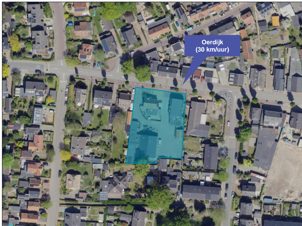
Figuur 1.1 Luchtfoto met ligging van perceel Oerdijk 34-36 en de directe omgeving

In figuur 1.1 is een luchtfoto met het perceel aan de Oerdijk 34 en 36 en de directe omgeving weergegeven. In figuur 1.2 is een situatietekening van de nieuwe situatie weergegeven.