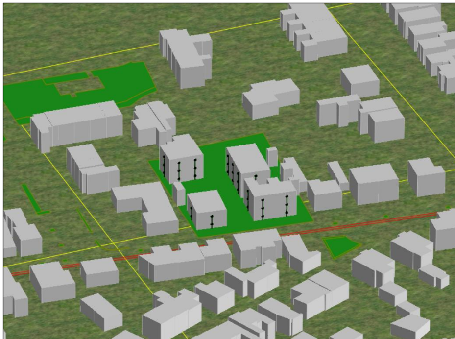
Figuur 3.1 3D impressie rekenmodel wegverkeer