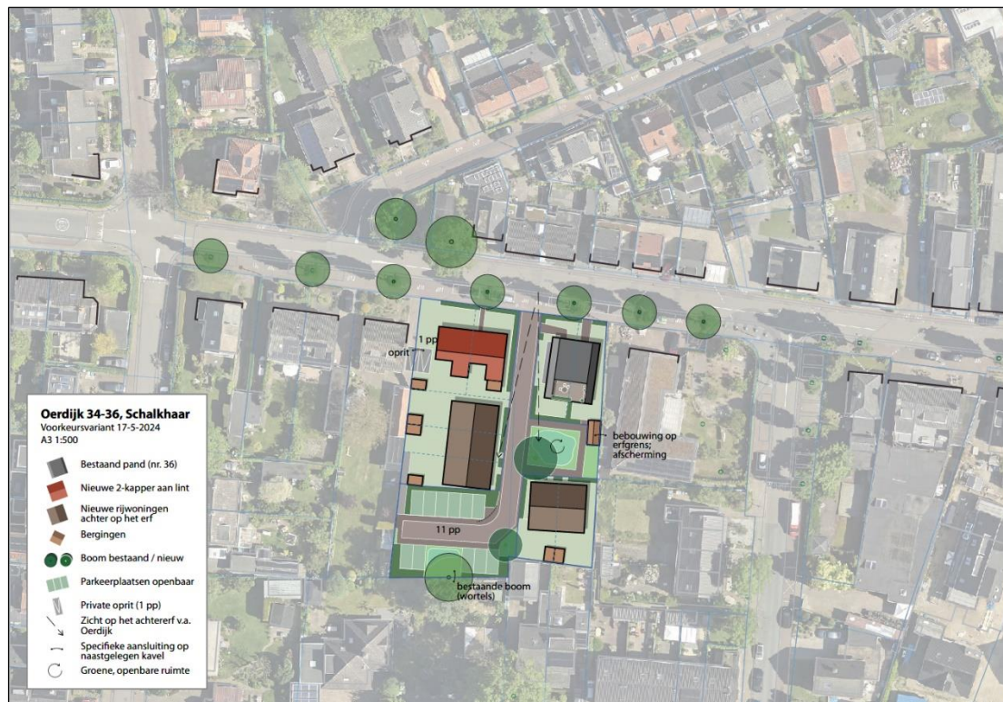
Figuur 1.2 Situatietekening nieuwe situatie

De nieuw te realiseren woningen zijn gelegen binnen het geluidaandachtsgebied van de gemeenteweg Oerdijk.