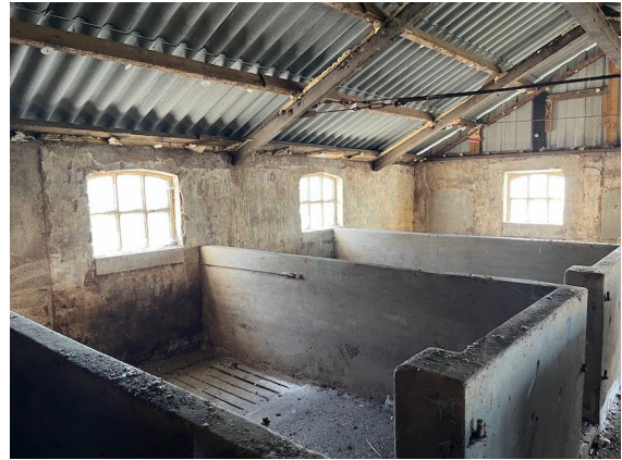
Figuur 5. Binnenzijde van de stal.