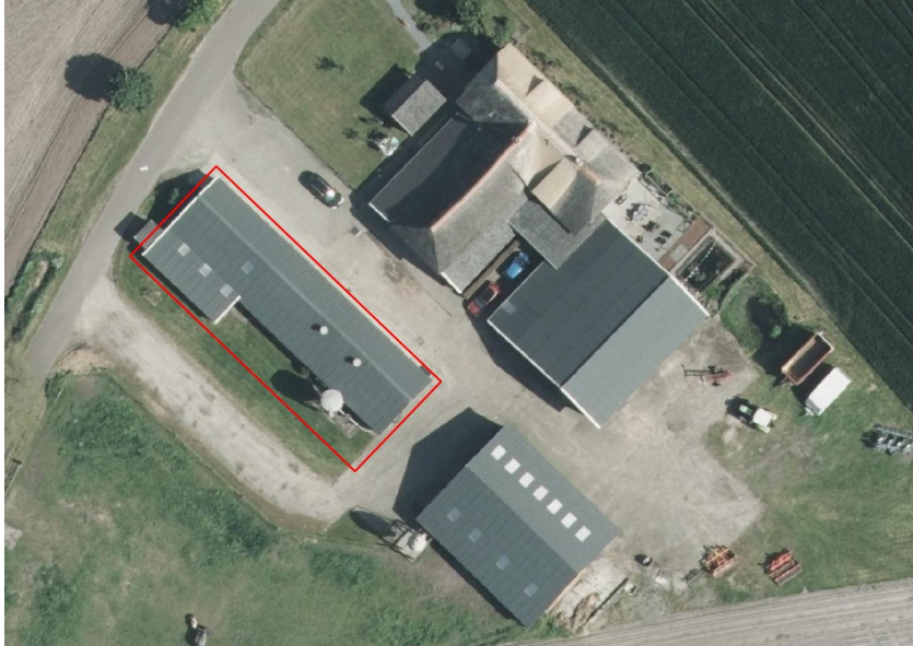
Figuur 2. Te slopen stal (rood) t.p.v. Schiphorsterweg 4.

Het plangebied wordt gevormd door een woning uit 2013. De gevels zijn gemetseld en het dak is gedekt met riet. Op grond van het bouwjaar en de aanwezigheid van gevelventilatie is een spouw aanwezig bestaande uit een luchtspouw bij het buitenblad en een laag isolatie tegen het binnenblad. Het gebouw wordt in oostelijke richting verlengd waarbij de huidige oostelijke kopgevel uit wordt gebroken. De locatie van de uitbreiding wordt gevormd door gazon.