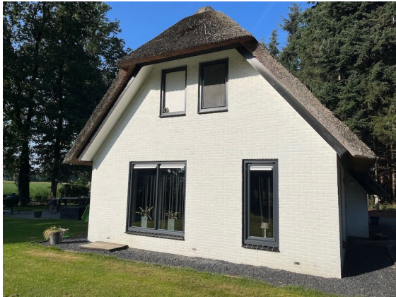
Figuur 6. Oostgevel van de woning aan de Klinkerweg.