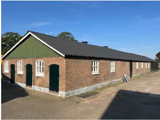
Figuur 4. Aanzien van de stal t.p.v. de Schiphorsterweg.