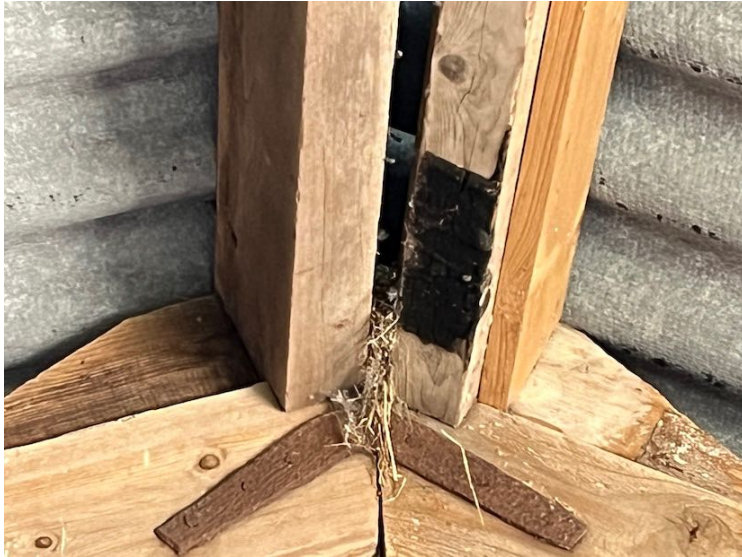
Figuur 8. Oud nest van vermoedelijk huismussen tussen de nokbalken van de stal.

De stal is in theorie geschikt als nestplaats voor boerenzwaluw maar van deze soort zijn geen nesten aangetroffen en de stal is ook niet toegankelijk voor zwaluwen. Voor uilen is de stal ongeschikt als nestplaats omdat besloten plekken ontbreken.