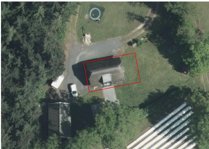
Figuur 3. Uit te breiden woning (rood) t.p.v. Klinkerweg 2.