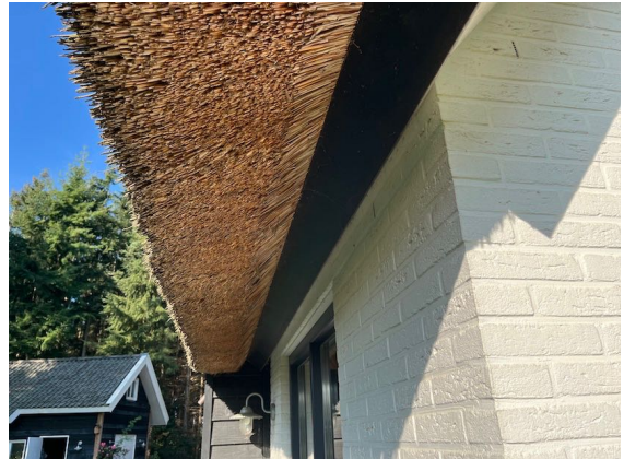
Figuur 7. Dakrand van de woning.