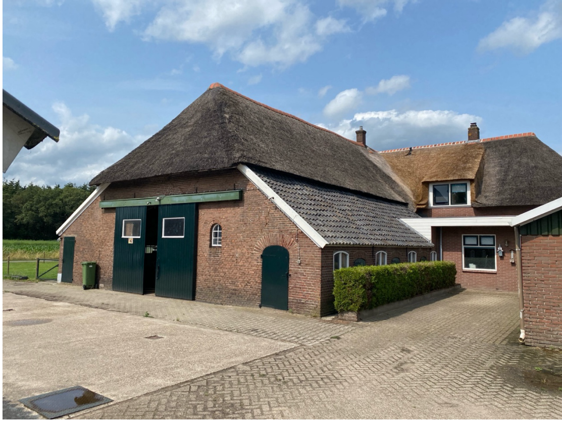
Erf zijde bestaande kapschuur