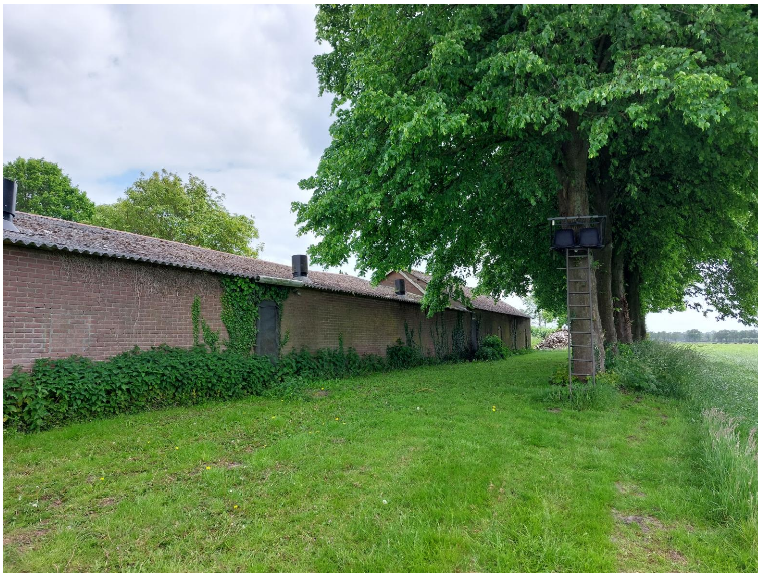
Afbeelding 8: Zicht vanaf het perceel op de zes solitaire lindes, situatie op 25 mei 2023.