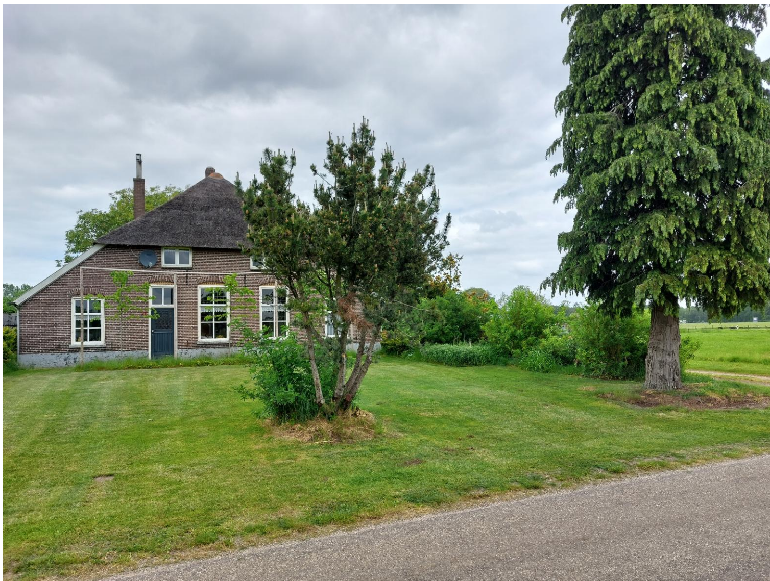
Afbeelding 11: Zicht vanaf de Oxersteeg op de naaldbomen en de sierbeplanting, situatie op 25 mei 2023.