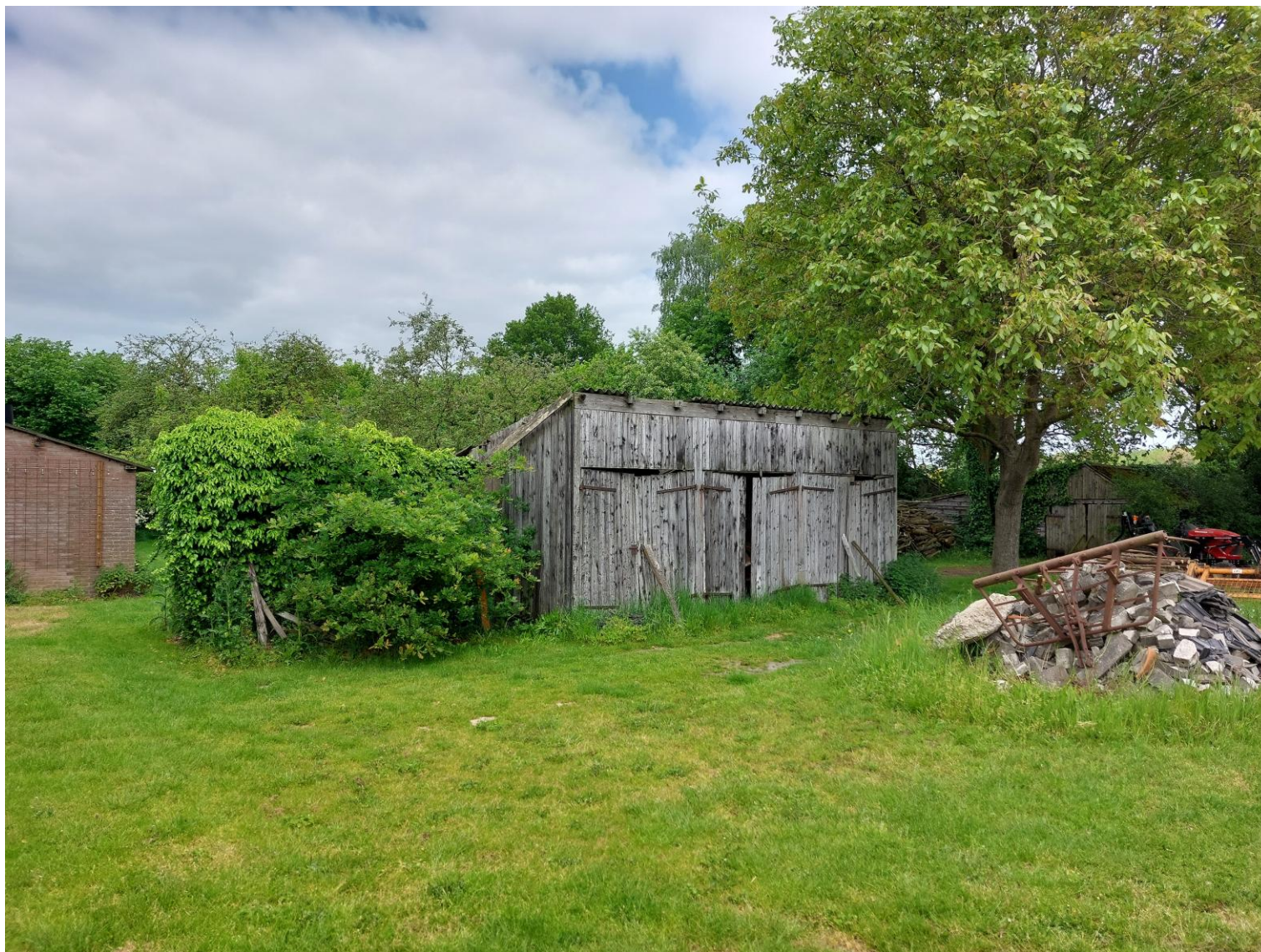
Afbeelding 6: Zicht vanaf het perceel op het te verwijderen bijgebouw van de varkensstal uit afbeelding 4, situatie op 25 mei 2023.