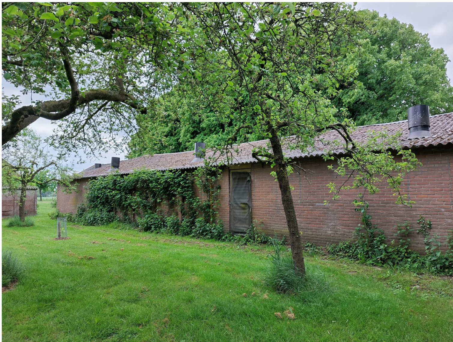
Afbeelding 4: Zicht vanaf het perceel op één van de te verwijderen varkensstallen, situatie op 25 mei 2023.