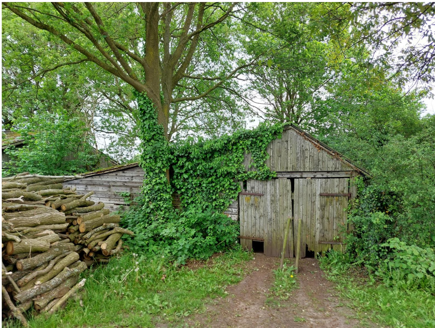
Afbeelding 7: Zicht vanaf het perceel op het te verwijderen bijgebouw van de varkensstal uit afbeelding 5, situatie op 25 mei 2023.