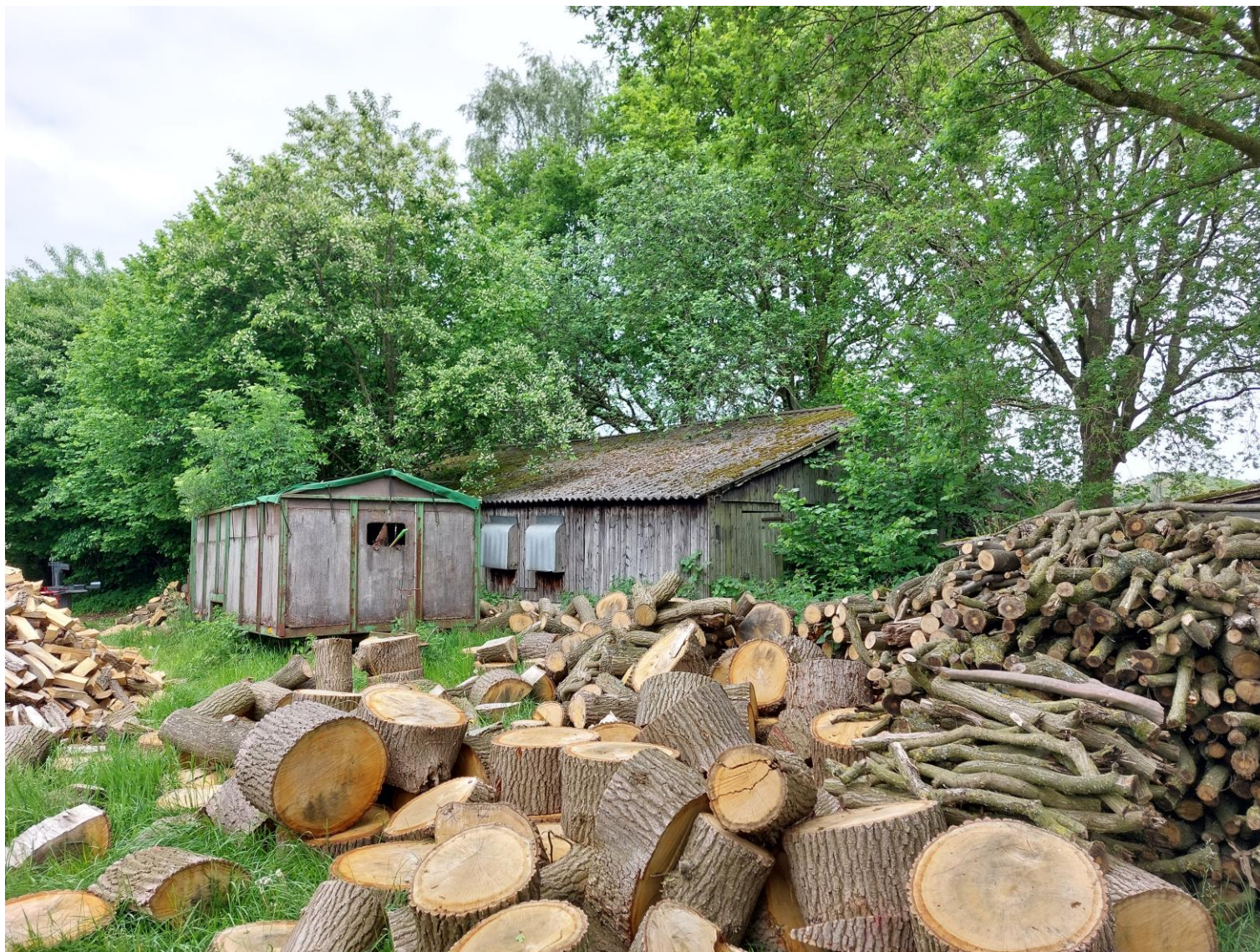
Afbeelding 5: Zicht vanaf het perceel op één van de te verwijderen varkensstallen, situatie op 25 mei 2023.