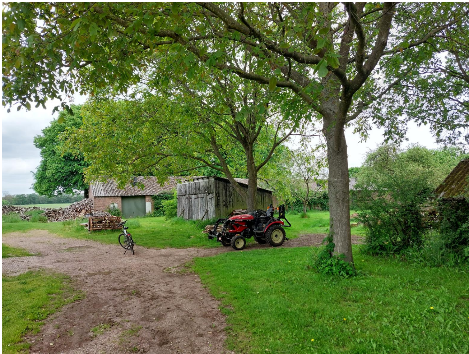
Afbeelding 9: Zicht vanaf het perceel op de twee solitaire notenbomen, situatie op 25 mei 2023.