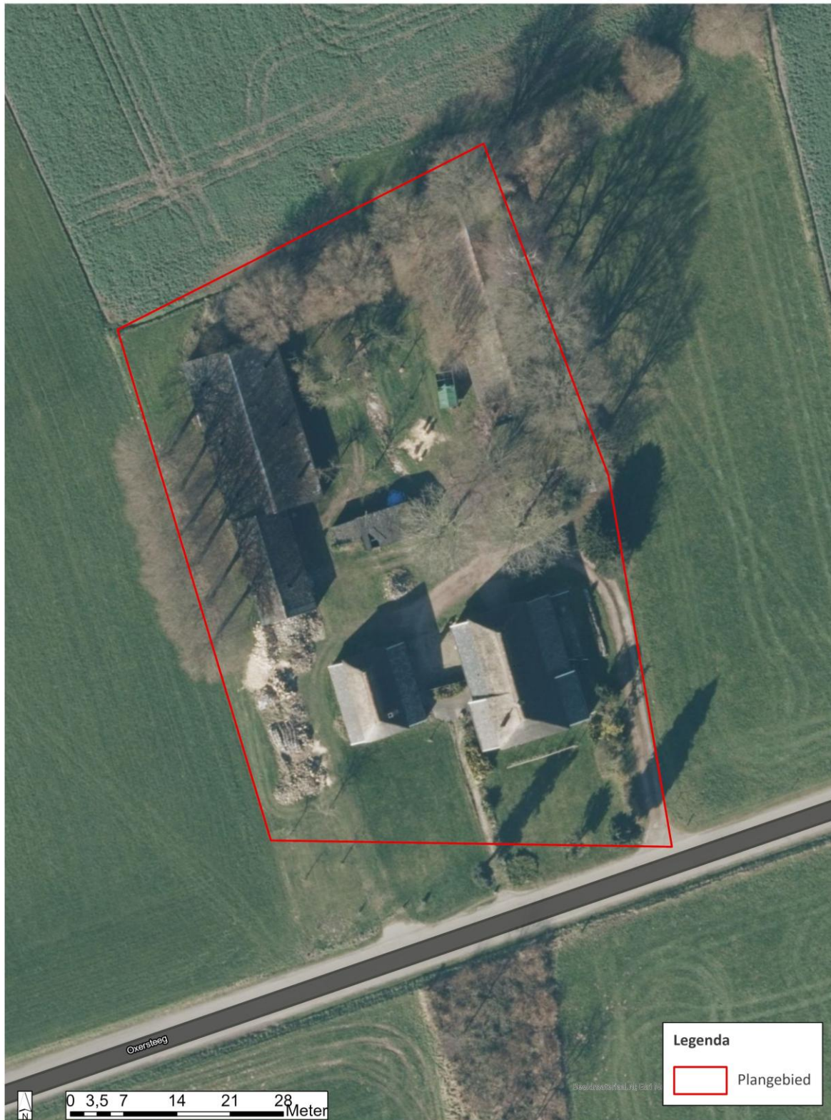
Afbeelding 2: Luchtfoto van het plangebied.