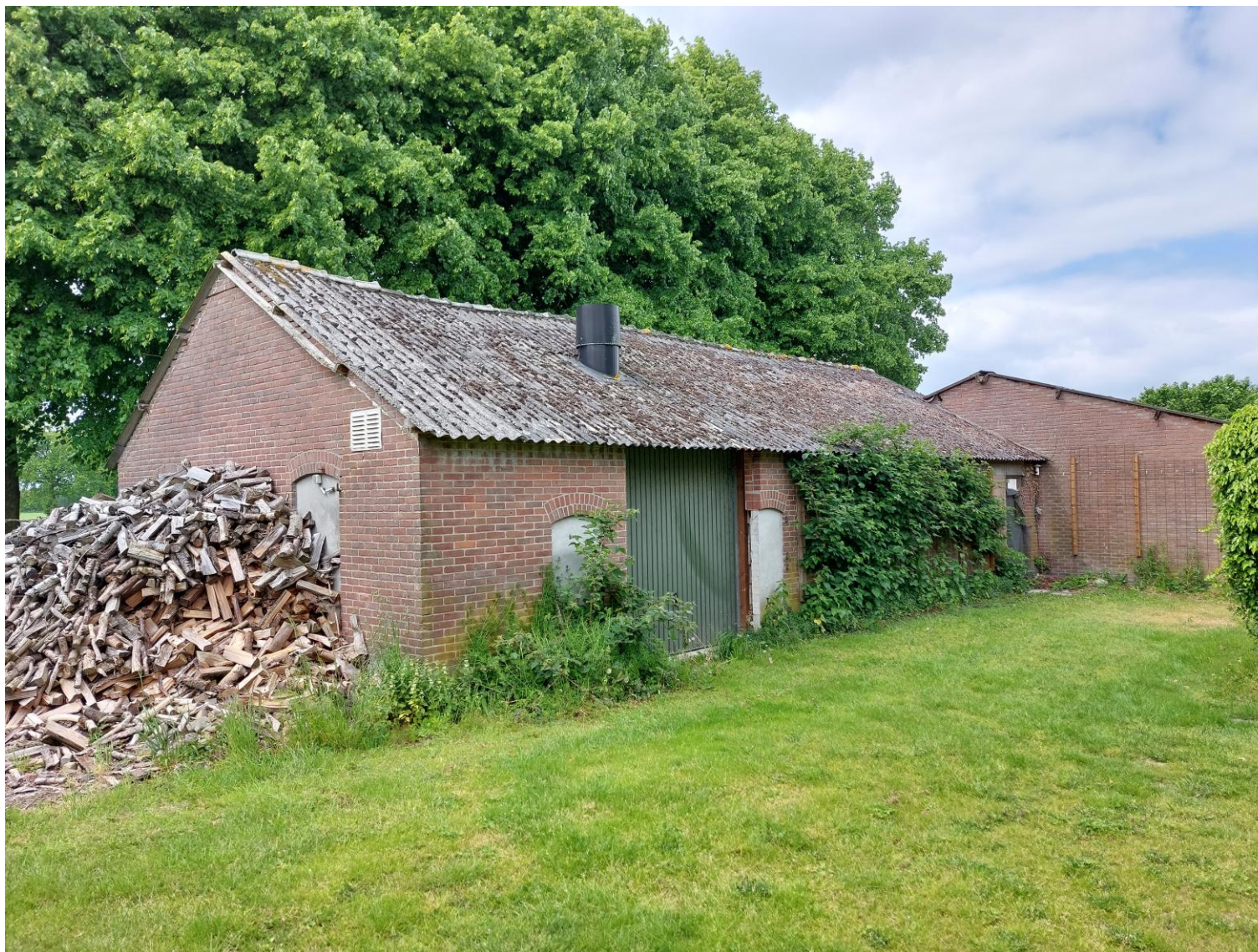
Afbeelding 12: Zicht vanaf het perceel op de schuur waarvan het asbestdak zal worden vervangen, situatie op 25 mei 2023.