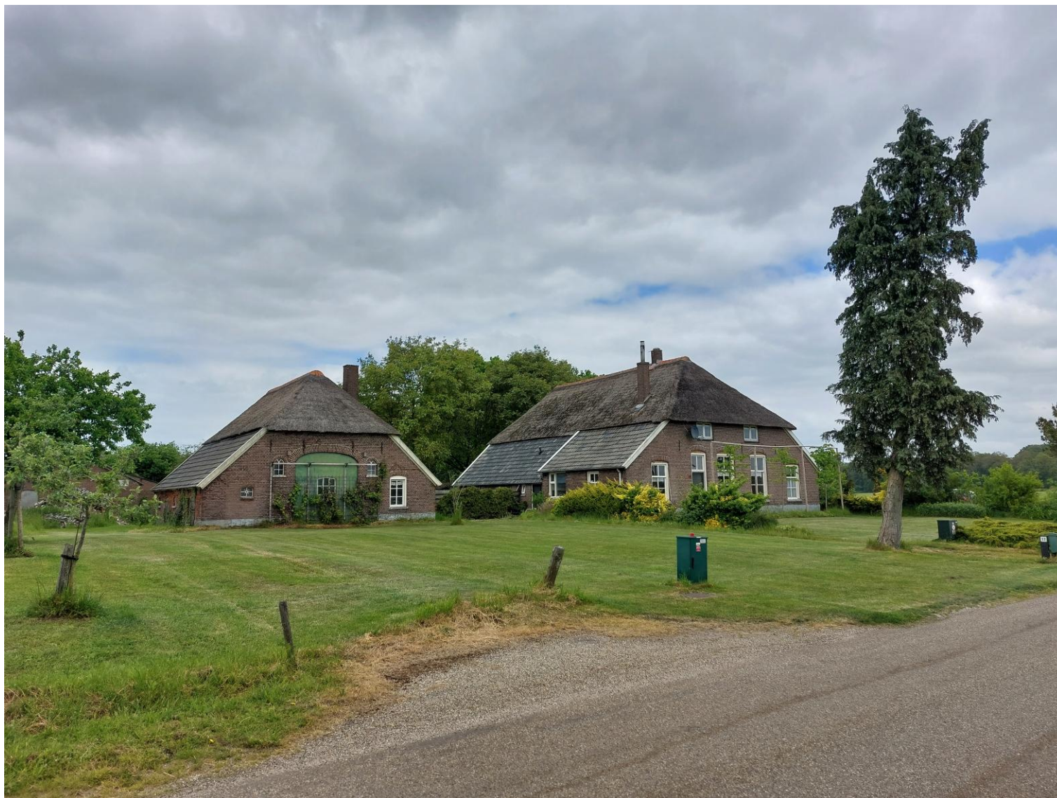
Afbeelding 3: Zicht vanaf de Oxersteeg op de woonboerderij met drie leibomen (rechts) en het bijgebouw (links), situatie op 25 mei 2023.