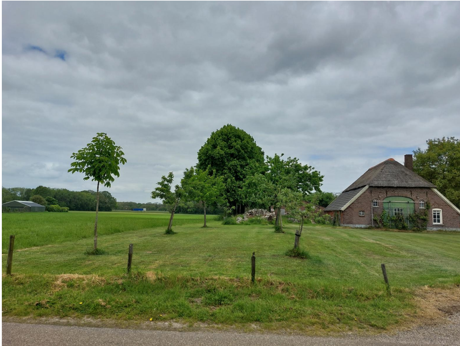
Afbeelding 10: Zicht vanaf de Oxersteeg op de fruitbomen, situatie op 25 mei 2023.