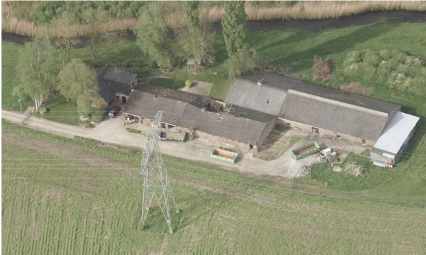
Luchtfoto Oerdijk 118, gemaakt op 14-04-2024