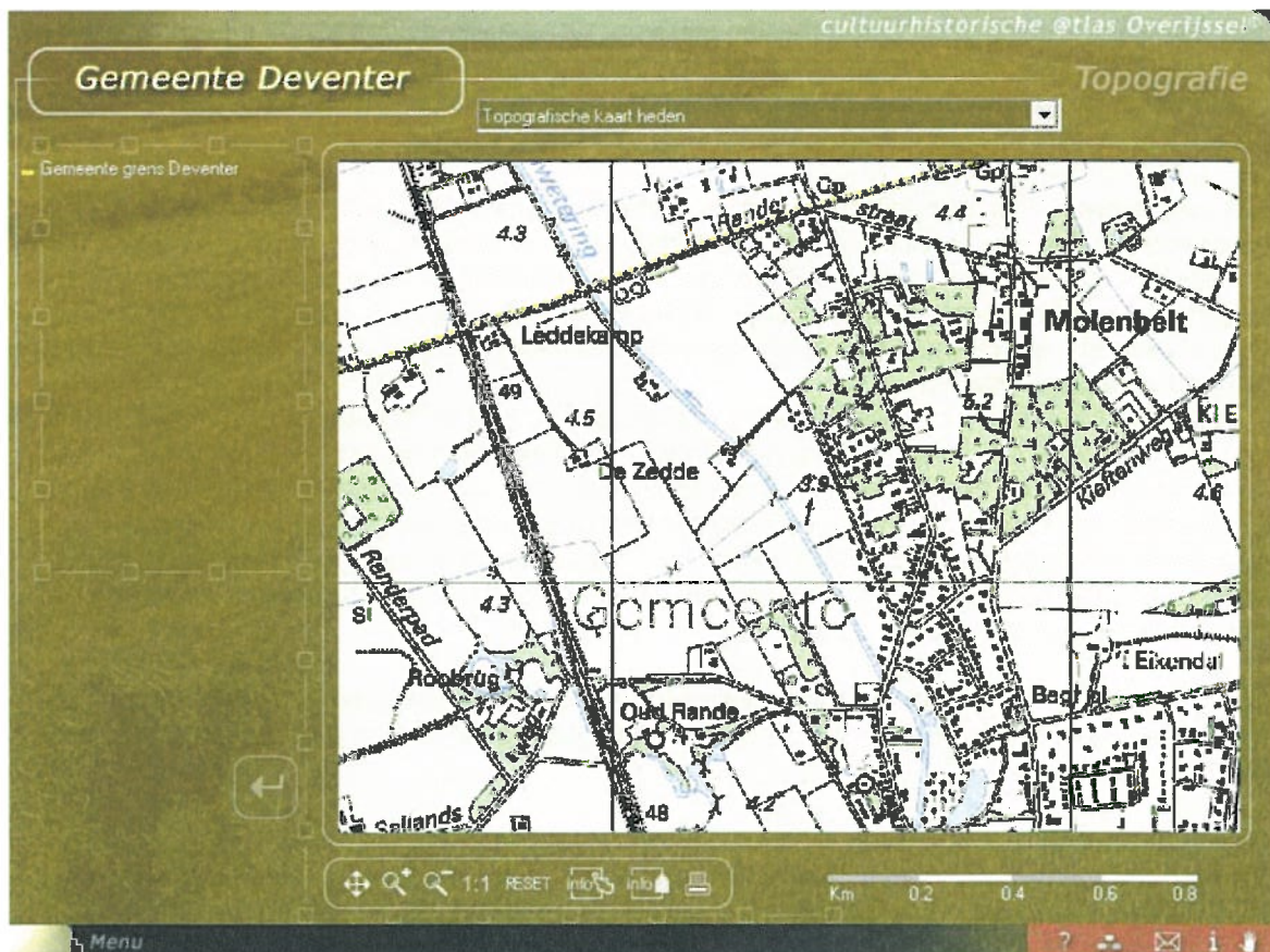
kaart 2: uitsnede van het plangebied, topografische kaart (cultuurhistorische atlas Deventer)

De uiteindelijke beleving van het landschap valt of staat met goed en zorgvuldig beheer door het waterschap. Het Oversticht adviseert om goede afspraken te maken over de beheersmaatregelen. Het inrichtingsplan biedt hiervoor prima uitgangspunten (jaarlijks maaien van 3 percelen en een keer per drie jaar maaien van het landschapskunstwerk). Het is raadzaam in de praktijk te monitoren of hiermee inderdaad het gewenste ruimtelijk beeld ontstaat.