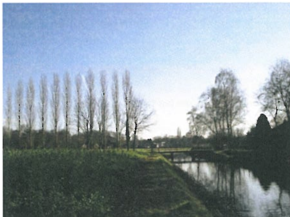
foto 2: doorkijkjes ontstaan door clusters van opgaande beplanting

De cultuurhistorische kaarten uit het inrichtingsplan geven inzicht in de ontwikkeling van het gebied door de jaren heen. Hieruit blijkt dat, hoewel het gebied altijd een relatief open karakter heeft gehad, er altijd afwisseling is geweest in de mate van openheid. Het landschap is nooit een 'leeg' landschap geweest, maar kent door de jaren heen een beeld met meer of minder boomgroepen, bomenrijen en bossages. De doorkijkjes op het landschap zijn in de loop der jaren dan ook verschillend geweest.