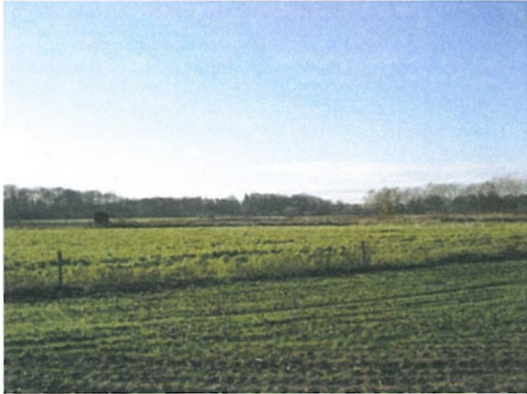
foto 1: halfopen landschap met dichte randen (deze foto is genomen vanaf de dorpsrand Diepenveen richting de Zandwetering)

De openheid van het plangebied wordt hier en daar doorbroken door opgaande beplanting of erven. Hierdoor ontstaat een gevarieerd beeld, met verschillende doorkijkjes op het landschap. In de loop der jaren is de mate van openheid in het gebied variabel geweest (zie kader).