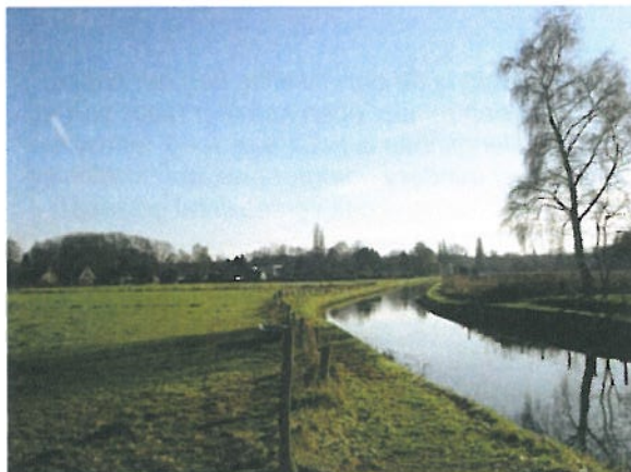
foto 4: de Zandwetering is hier nooit in zijn geheel te overzien en nodigt uit om 'om het hoekje te komen kijken'

De Zandwetering is momenteel nauwelijks zichtbaar in het landschap. Alleen van dichtbij of wanneer de Zandwetering wordt gekruist (bruggen) is het water beleefbaar. Van een afstand is het water niet te zien. (zie foto 1)